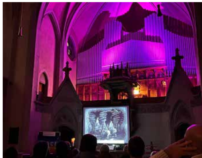
Bei der Lichtmeile herrscht in der Diakoniekirche Luther eine ganz besondere Stimmung.

die Paul-Gerhardt-Kirche (Neckarstadtgemeinde).