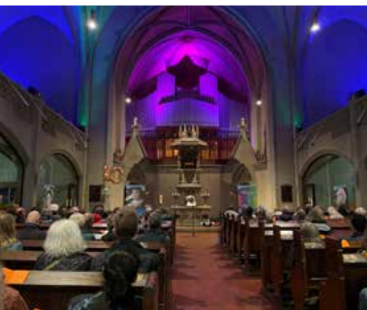
Zum Tag des offenen Denkmals kamen etliche Menschen vorbei, die meinten, dass sie noch nie in der Kirche drin waren ... Wir zeigen sie gern.