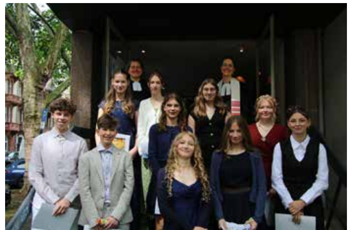
Die diesjährigen jungen Menschen, konfirmiert in zwei Gottesdiensten. Herzlichen Glückwunsch und Gottes Segen.