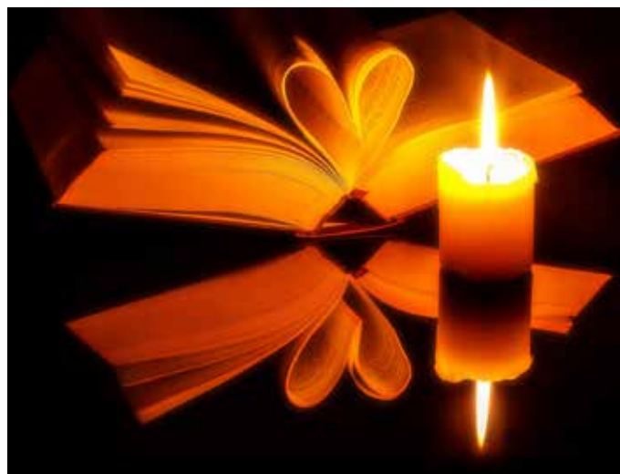
„Du bist eingeschrieben in das Buch des Lebens.“ Offenbarung 21,27.

Uhr, Gottesdienst mit Gedenken der Verstorbenen des Kirchenjahres, Melanchthonkirche