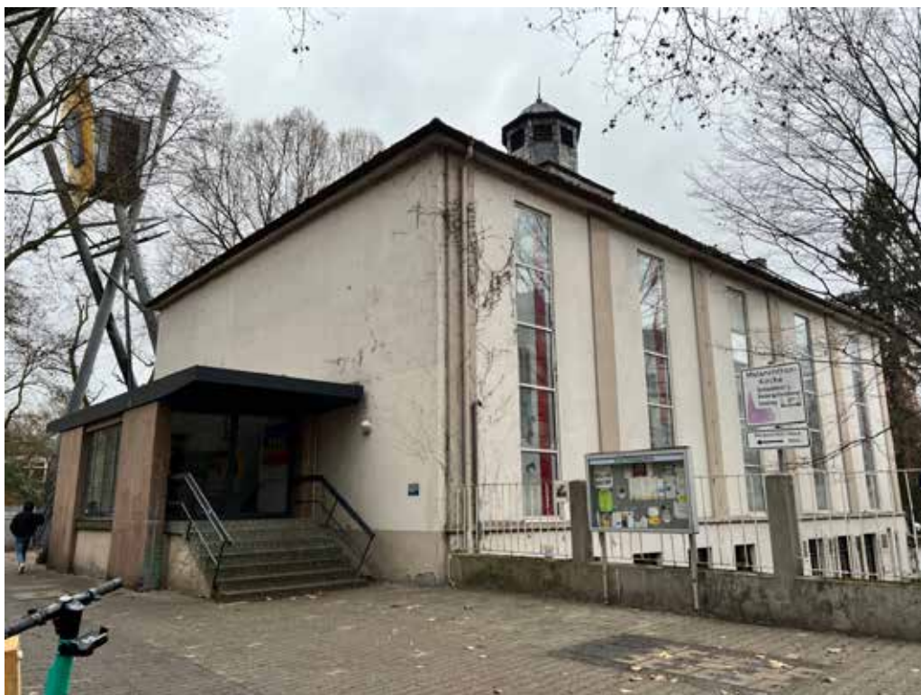
Die Melanchthonkirche in der Lange Rötterstr. 39 soll einen neuen Vorbau, hinten einen Anbau und innen einen Umbau bekommen.