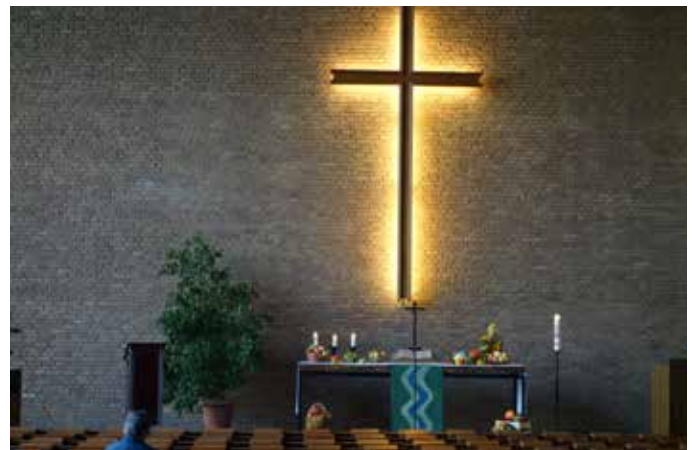
Erntedankaltar Paul-Gerhardt-Kirche.

Sonntag, 5. Oktober, 10:00 Uhr, Erntedankfest, Melanchthonkirche