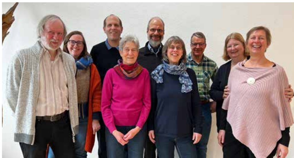
Mitglieder des aktuellen Ältestenkreises in sanctclara.

Persönliche Schwerpunkte meiner Arbeit sind Kirchengaustritte, Kirchenschließungen, das Abwandern vom Glauben an unseren Herrn! Mitbringen für die Arbeit im ÄK sollte man Sitzfleisch, Ausdauer, die Fähigkeit, zuhören zu können und die Freude am Herrn. Ich kann das nicht – ich werde nicht gebraucht, so sollte man sich nicht sorgen. Jeder kann sich auf seine Weise eingeben, jeder ist willkommen. Darum: Du wirst gebraucht, deine Stimme ist gefragt. Probiere doch eine Amtszeit aus. Lerne die anderen kennen, traue dich! Du bist