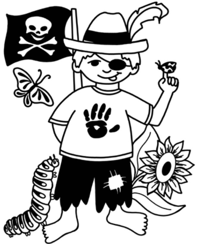
Kita Am Brunnengarten, ehemals Krümelchen. Im Logo sind die vier Gruppen der Kita dargestellt.

Die Einrichtung wurde immer wieder angebaut und modernisiert,