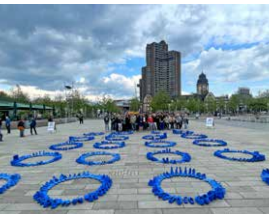
Als Grüner-Gockel-Gemeinde beteiligen wir uns am Earth Day. 1.000 blaue Schuhe auf dem Alten Messplatz setzen ein Zeichen für den Schutz von Klima und Gewässern. #KunsttrifftKliMa