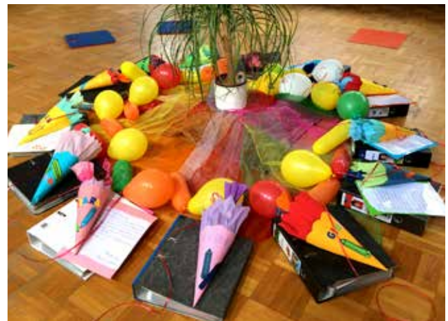
Wir verabschieden unsere Vorschulkinder mit Schultüten, Gebet und Segen aus ihrer Kindergartenzeit in die Schule. Die Melanchthonkita feiert den Abschied in der Melanchthonkirche am 19. Juli, die Kita Käfertaler Straße am 30. Juli in der Kita.

Sonntag, 27. Juli, 10:00 Uhr Melanchthonkirche