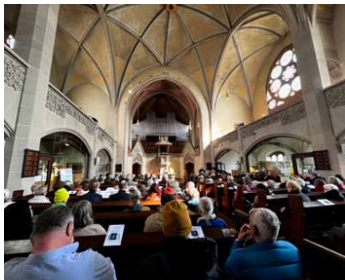
Gottesdienst zur Verabschiedung der Diakonin Andrea Weiß.

Im Moment wird über einen Diakoniepunkt am Neuen Messplatz nachgedacht. Frühestens im Herbst 2027 können unsere Gäste dann am neuen Ort Sozialberatungen, Café, Computerraum und Geistliches genießen. Bis dahin fließt noch viel Wasser den Neckar hinunter, und wir freuen uns derweil über viele Gäste, Mitarbeitende und Spender:innen für unsere Arbeit an der