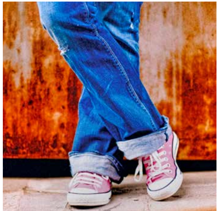
Im hebräischen Urtext ist sie nur als große Frau aus Schunem benannt. Wir erfahren von ihrem Tun und Leben im 2. Buch der Könige, Kapitel 4, 8-37 und im 8. Kapitel in den Versen 1-6.

Mit den größeren Klassen fangen wir das Schuljahr wieder im Herzogenriedpark