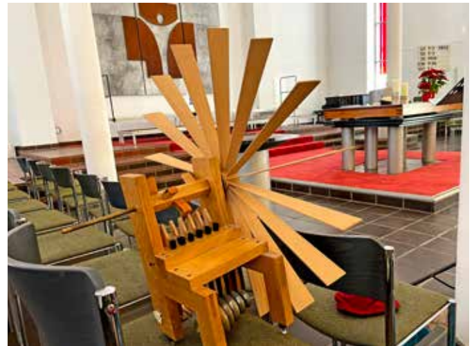
Der Zimbelstern unserer Orgel.

Mittwoch, 3. September, 20:00 Uhr, Kunsthalle Mannheim, Friedrichsplatz 4, Eintritt frei