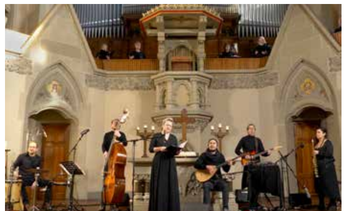
Musik-Welten-Konzert in der Diakoniekirche.