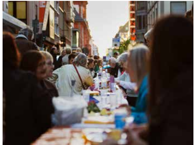
Meile der Religionen.

Konkordien über den Marktplatz bis hin zur Synagoge