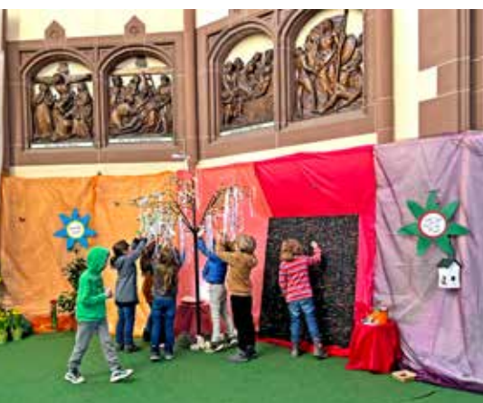
Uhlandgrundschüler:innen besuchen den Ostergarten in der Jugendkirche Samuel. Sehen Sie sich den Garten 2025 in der Neckarstadt in St. Nikolaus an. Es lohnt sich!