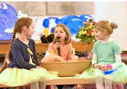
Alle Vögel sind schon da. Fröhliches Frühlings-singen beim Musical „Vogelhochzeit“