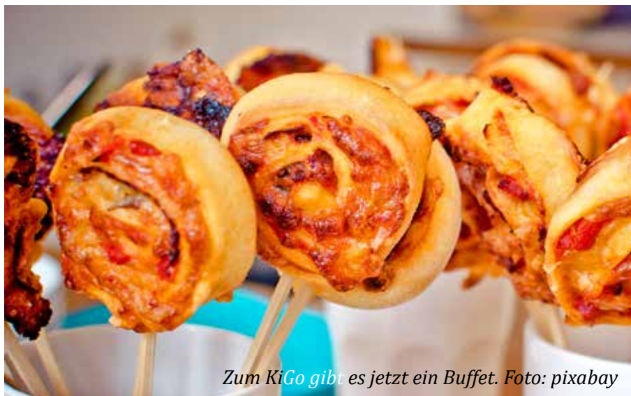
Zum KiGo gibt es jetzt ein Buffet.

len, basteln und beten gemeinsam und finden vielleicht neue Freundinnen und Freunde. Jede und jeder ist eingeladen. Manches von dem, was wir vorbereiten, passt am besten für Kinder zwischen 4 und 9 Jahren – aber Kleinere, Größere, Eltern und Großeltern dürfen gerne dazukommen. Wir beginnen den Gottesdienst alle zusammen um 10:00 Uhr mit den Jugendlichen und Erwachsenen im großen Kirchenraum und gehen dann, wenn wir unsere Kindergottesdienst-Kerze entzündet haben, nach unten in unseren KiGo-Raum, um hier weiterzufeiern.