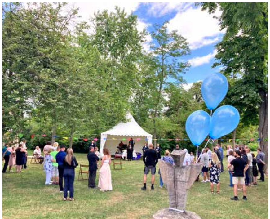
Sommerliches Tauffest für viele Täuflinge mit anschließender Einladung zum gemeinsamen Fest am 6. und 7. Juli. Informationen über das Pfarramt.