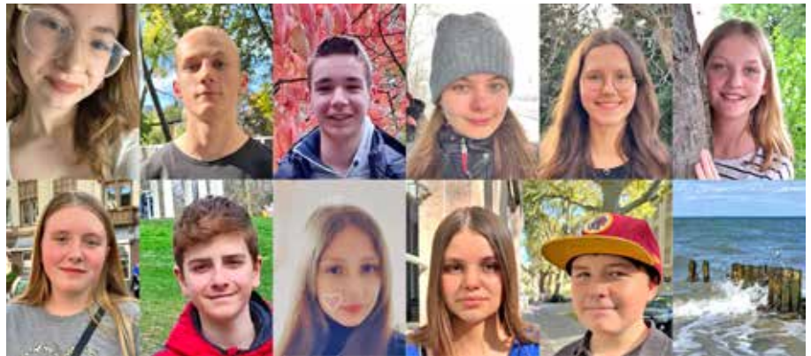
Konfirmanden reisen zum KonfiKompakt an die Ostsee und werden am 12. Mai konfirmiert.