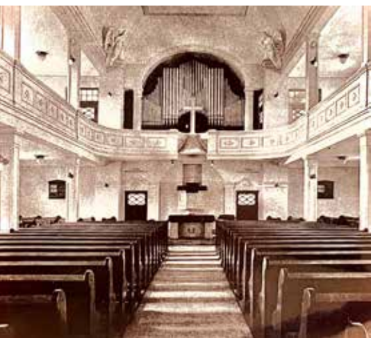
Die Melanchthonkirche vor 100 Jahren.