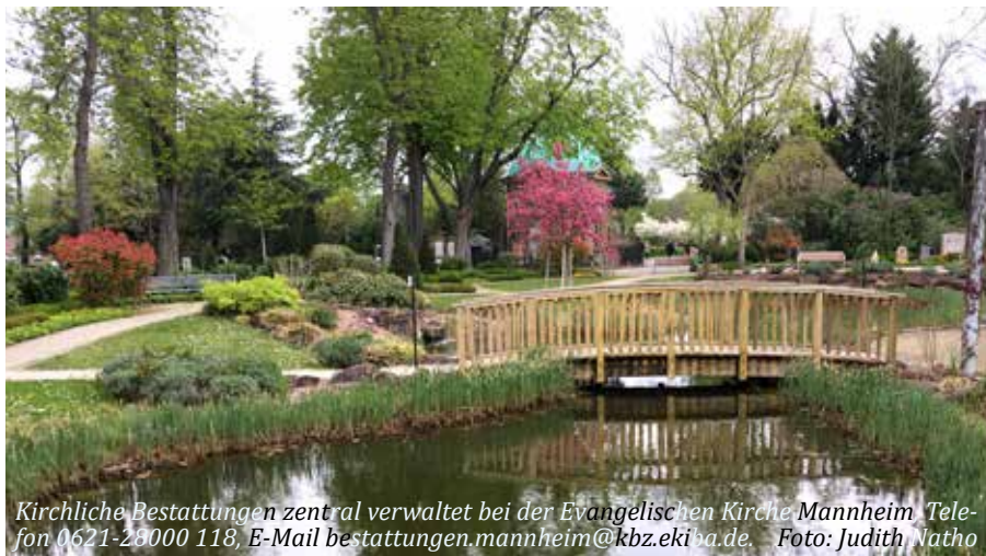
Kirchliche Bestattungen zentral verwaltet bei der Evangelischen Kirche Mannheim. Telefon 0621-28000 118, E-Mail bestattungen.mannheim@kbz.ekiba.de.