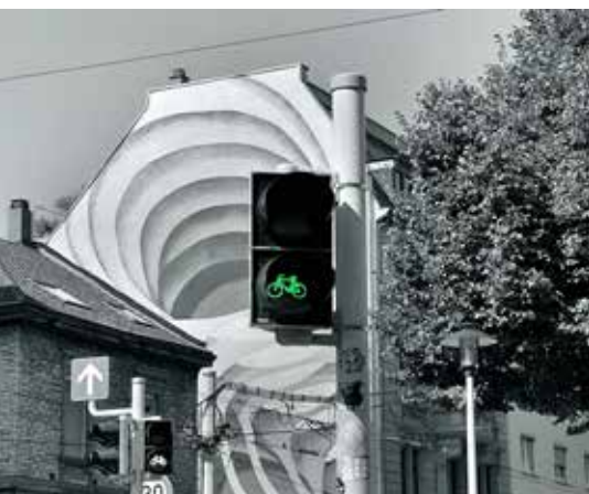
Die Ampel am Eingang zur Neckarstadt West.

Es gab eine Zeit, da kam der Straßenverkehr ohne Ampeln aus.