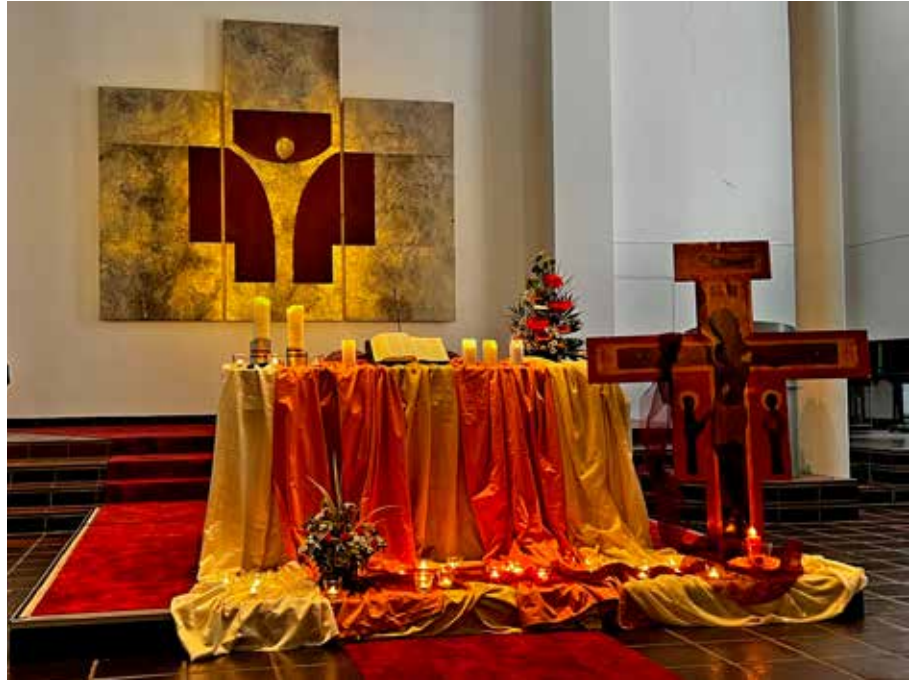
Taizé- und Musikgruppen aus Mannheim und unser Taizé-Team feiern zusammen eine Nacht der Lichter am 8. November in der Melanchthonkirche.

Freitag, 8. November, 19:00 Uhr, Melanchthonkirche