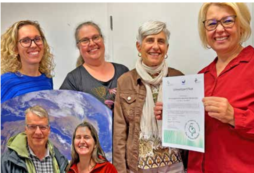
Hurra, wir sind EMAS-zertifiziert – hier ist unsere Urkunde. Überreicht wurde sie uns zur Jubiläumsfeier 20 Jahre Grüner Gockel am 20. September in der Stadtkirche in Karlsruhe. Darauf darf unsere ganze Gemeinde sehr stolz sein und weiterhin fleißig mitwirken.