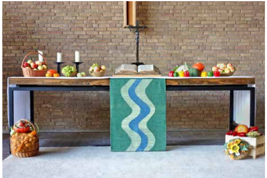
Herzlich eingeladen sind alle Neckarstädter zu den Erntedankfestgottesdiensten am 6. Oktober an Paul-Gerhardt und Melanchthon jeweils um 10:00 Uhr.

Erntedankfest in Melanchthon Samstag, 5. Oktober, 16:00 Uhr, Kinderkirchennacht Sonntag, 6. Oktober, 10:00 Uhr, Familiengottesdienst, Melanchthonkirche