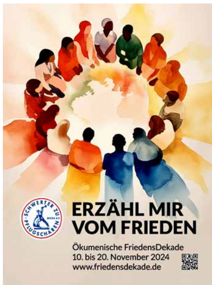
Am 12. November zeigen wir den Film zur Friedensdekade „Camino a la paz“. Infos S. 8

Sonntag, 24. November, 10:00 Uhr , Melancthonkirche