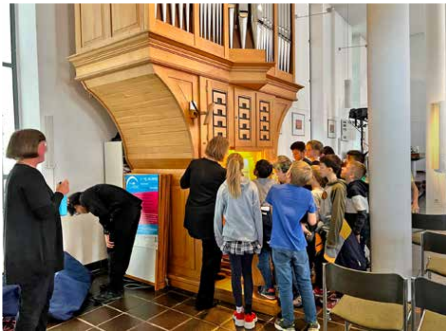
Mit viel Interesse verfolgten die Kinder beim internationalen Orgelfestival 2023 das Kinderkonzert „Peter und der Wolf“ für Orgel und Puppenspieler in der Melanchthonkirche und ließen sich anschließend die Heintz-Orgel zeigen.

Vorverkauf: Pfarrbüro Lange Rötterstr. 39 und beim Lufticus.