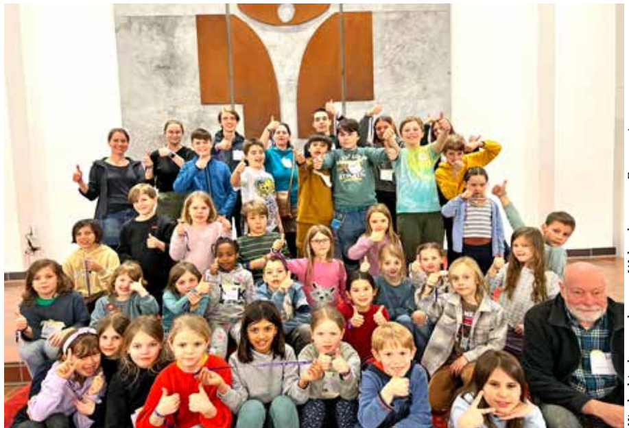
Kinderkirchennacht zum Weltgebetsstag, Foto: privat

Vom 5. bis 6. Oktober , Start 16:00 Uhr, Ende 12:00 Uhr (mit Gottesdienst am Sonntag), Melanchthonkirche