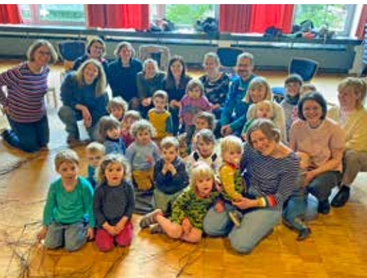
Das „Spatzennest“, der Chor unserer Kleinsten.

So viele Facetten der Seele können neben Bildern auch Worte und insbesondere die Musik ausdrücken. Ich fühle mich verstanden von Musik, die für mich oftmals vom Himmel ins Herz eindringt.