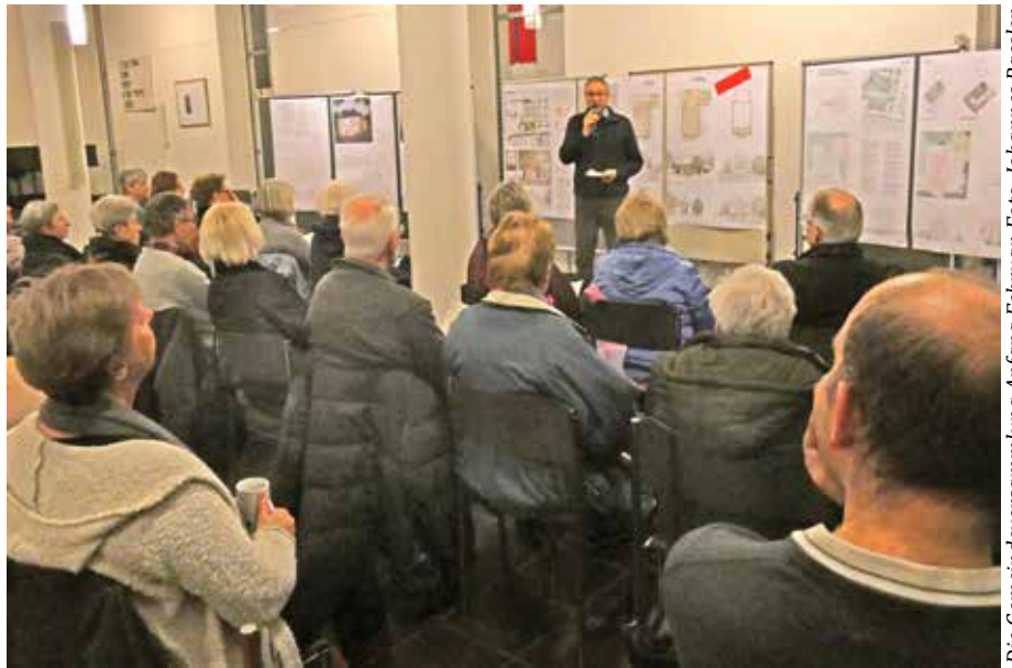
Die Gemeindeversammlung Anfang Februar.

Nach den eindeutigen Rückmeldungen aus der Gemeinde hat sich der Ältestenkreis für das Büro von Entwurf 3 entschieden und dieses inzwischen mit der Planung für Sanierung, Umbau und Erweiterung der Melanchthonkirche beauftragt. Außerdem sind bereits erste fachplanerische Leistungen beauftragt, die als Grundlagen bzw. zur Begleitung für ein so komplexes Bauprojekt erforderlich sind. Die Bauabteilung der Kirchenverwaltung in M1 betreut das Vorhaben mit großem Engagement.