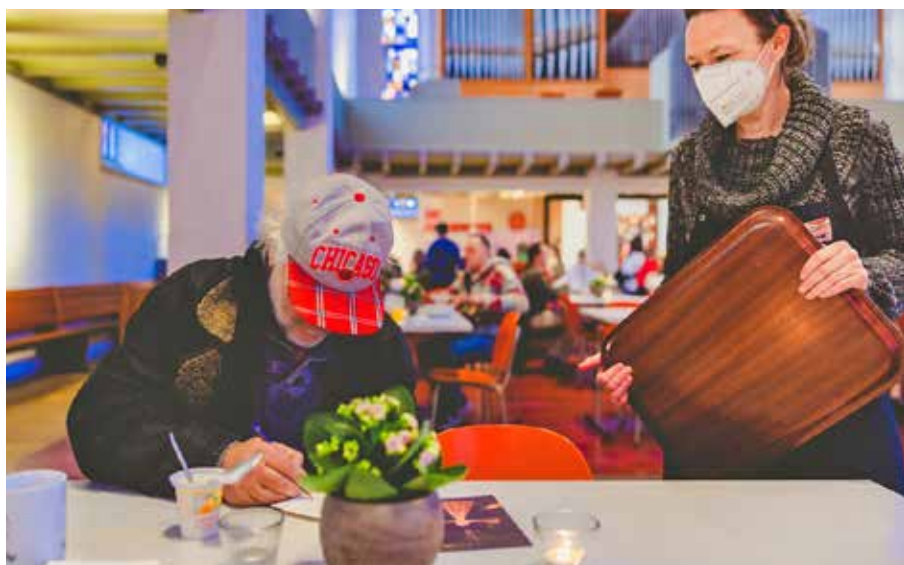
Vesperkirche 2022 – ein sehr eindrückliches Beispiel diakonischer Hilfe in ganz besonderen Zeiten.

Letztes Jahr wurden 81 Kuchen gespendet. Vielen Dank.