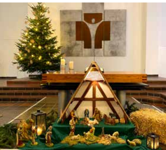
Die Weihnachtskrippe in der Melancthonkirche