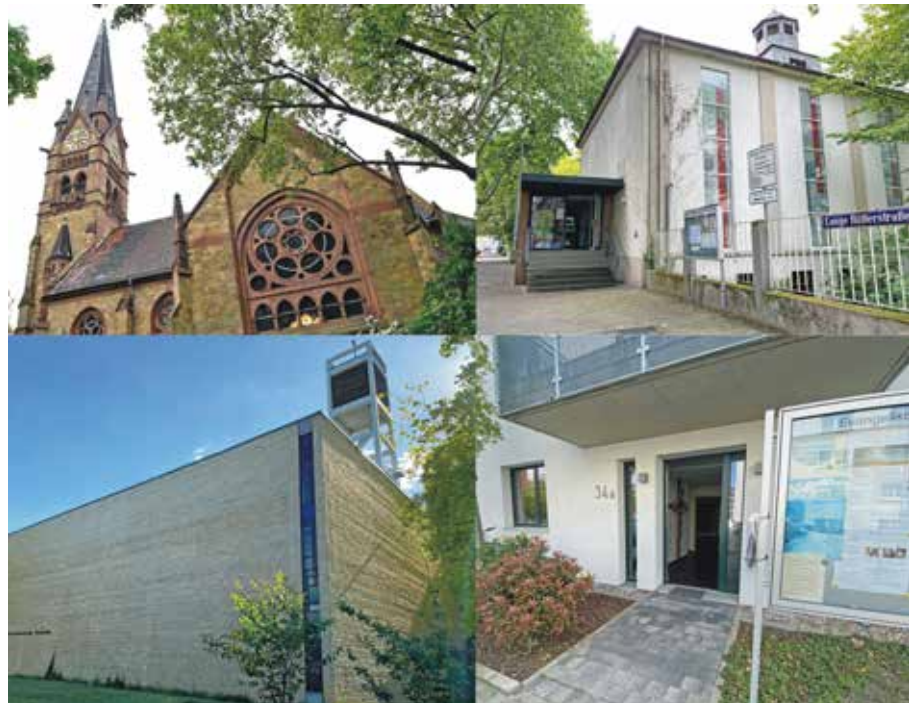
Die Kirchengebäude in der Neckarstadt. Fotos: Judith Natho, Collage: Johannes Paesler

Wichtig zu unterscheiden: Die Synode hat nicht über Kirchenschließungen entschieden. Sie hat lediglich festgelegt, in welche Standorte weiterhin verlässlich Kirchensteuermittel fließen. Das gibt für die A-Standorte Planungssicherheit und im Blick auf die künftige Nutzung der B- und C-Kirchen kann und muss das kreative Nachdenken beginnen.