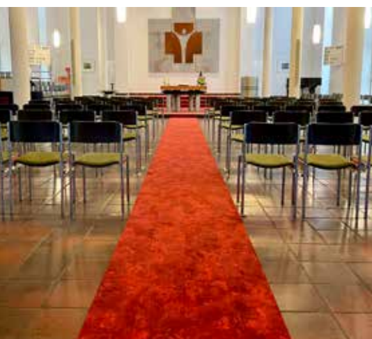
Melanchthonkirche: Hier sind Sie VIP und schreiten über den roten Teppich.