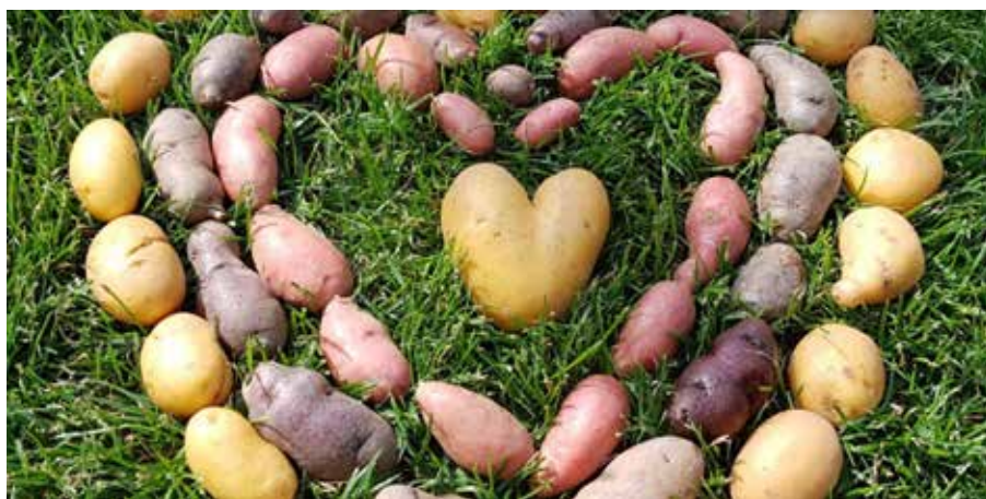
Landeskirche lässt Kartoffeln wachsen ( www.kartoffelaktion.de/kartoffelaktion-2022 ). Unsere Gemeinde beteiligt sich bei dem Projekt mit den Konfirmanden. Werden Sie Teil unserer Arbeitsgruppe und bringen Sie Ihre Ideen mit ein.

Neuer Titel der GG-Arbeit: Bewahrung der Schöpfung mit verschiedenen Untertiteln und -projekten: a) Grüner Gockel (im Hinblick auf Gebäude, Verbrauch, Zertifizierungsmaßnahmen, Umwelterklärung) b) „Aktionsgruppe xy“ zum Beispiel: Parking Day, oder Umwelt-Garten-Gruppe an Melanchthon für Groß und Klein, unter anderem mit Kinderchor-Familien und Interessierten, einmal monatlich, zum Beispiel erster Mittwoch im Monat 17:00 Uhr, Vernetzung mit weiteren Umweltgruppen und Klimakollekte.