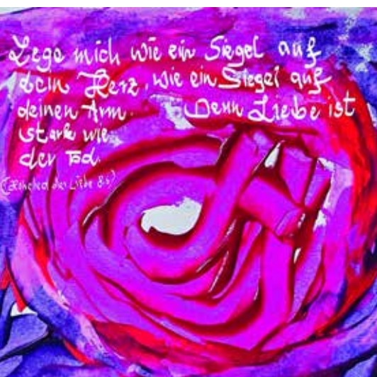
Monatsspruch für Juni, gemalt von Petra Czesla.