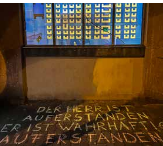
Die frohe Botschaft vor der Melanchthonkirche.