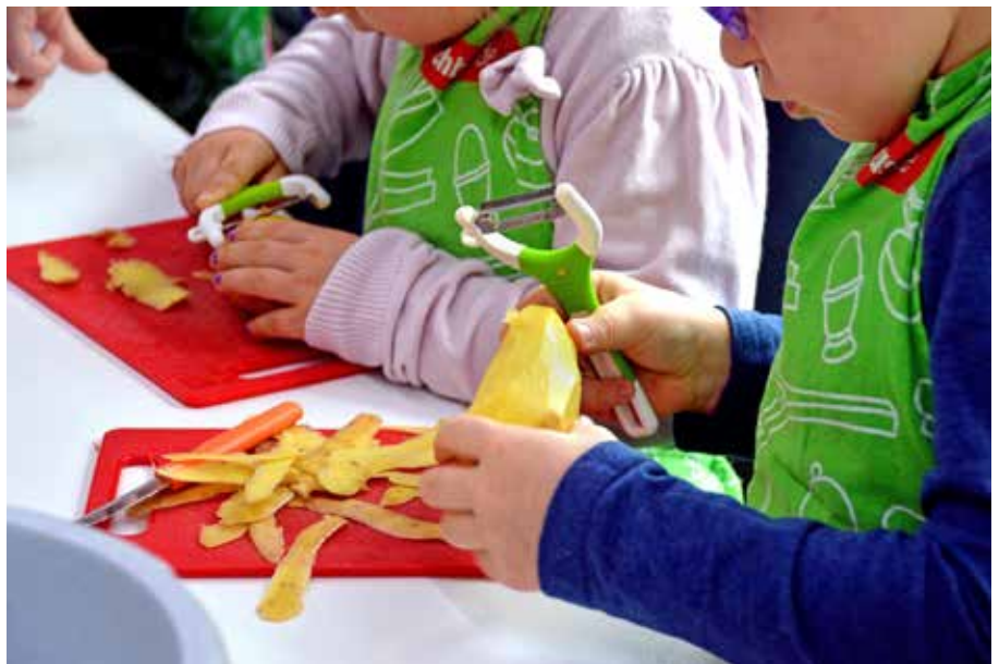
Das Projekt GeLeNa der Evangelischen Kirche hat unter bundesweit 45 Mitbewerbern den zweiten Preis und damit 7.000 Euro der Evangelischen Bank (EB) gewonnen.