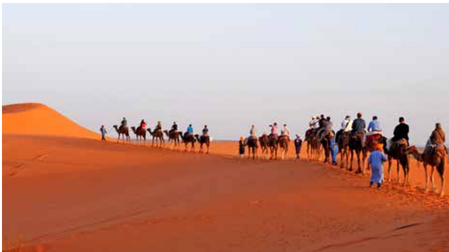
Miteinander Tee trinken, den Film anschauen und ins Gespräch kommen. Ein Marokko-Abend mit Köstlichkeiten für Leib, Seele und Geist.

Forum der Religionen seit 2007, Meile der Religionen, Interreligiöser Gebetsraum auf Franklin, öffentliche interreligiöse Gebete z.B. für die Corona-Verstorbenen, Gesellschaft für christlich-jüdische Zusammenarbeit, Christlich-Islamische Gesellschaft Mannheim e.V., Interreligiöse Musikbegegnungen, Mannheimer Forum der interreligiösen Musik, Susanne meets Samira an der Diakoniekirche Luther, wöchentliche Mittagessen der Ahmaddiya Muslim Jamaat für Gäste der Diakoniekirche Luther, Netzwerk „nachhaltige Gotteshäuser“, Netzwerk „Religionen und Kulturen im Miteinander“ für Lehrer:innen, Schalom, Salam und Frieden – Zusammenarbeit mit dem MIIA, gegen Rassismus, Antisemitismus und Islamophobie, Führungen in Kirche, Moschee und Synagoge, Miteinander diskutieren – Streitkulturen im Christentum und im Islam, Miteinander heilige Schriften lesen, Miteinander kochen und backen – Begegnungen in sancta clara und bei Stadtfesten, interreligiöse Schulfeiern, interreligiöse Klinikseelsorge, Notfallseelsorge, interreligiöser Dialog im Konfi-Unterricht, Reli-Unterricht in der Moschee, der Kirche, der Synagoge, interreligiöses Gedenken am Volkstrauertag, Gedenken der Reichspogromnacht, IVAA – interreligiöse Erziehung in den Kitas, Kindergarten Lâlezâr für muslimische und nicht-muslimische Kinder; Konzerte mit der orientalischen Musikakademie in der Neckarstadt