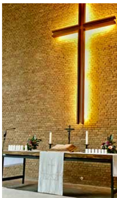
Totengedenken in der Paul-Gerhardt-Kirche

Ewigkeitssonntag, 21. November, 9:30 Uhr, Paul-Gerhardt-Kirche