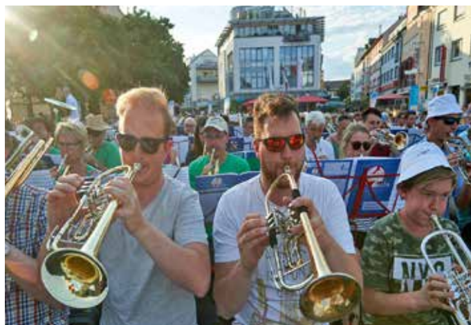
Foto links: Die Jungbläser 2011 bei einer Chorprobe. Bereits bereits knapp drei Monate nach Probenbeginn konnten sie ihren ersten Gottesdienst musikalisch gestalten. Foto rechts: Bald nahmen die Neckarstädter Bläser auch an Landesposaunentagen teil. Das Foto stammt aus dem Jahr 2019.