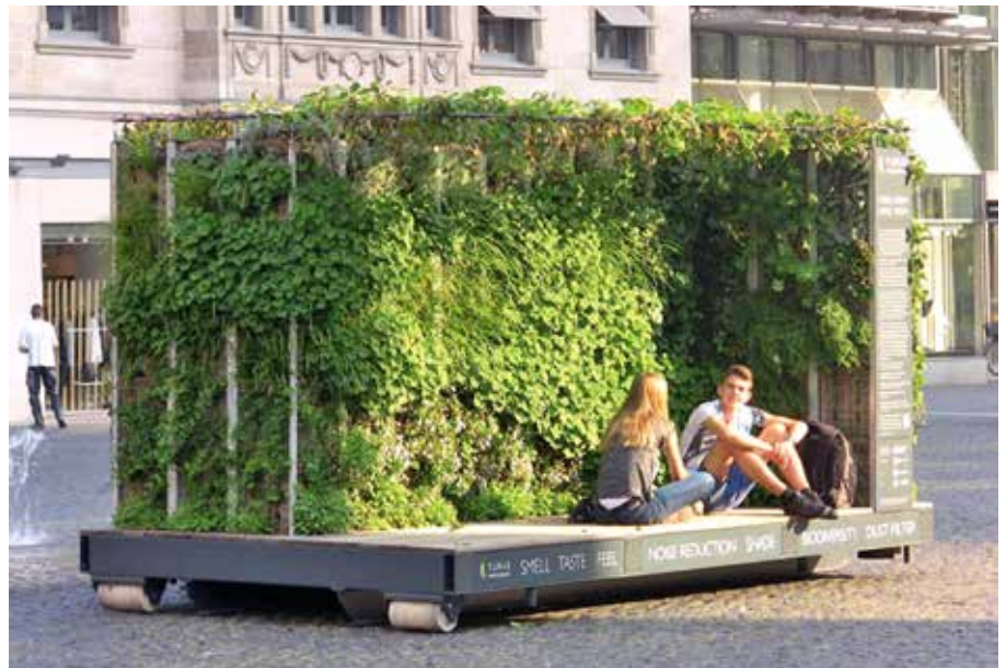
Die Neckarstadt bekommt ein „Grünes Zimmer“.

Nach den vier Wochen an der Paul-Gerhardt-Kirche wird das Grüne Zimmer an weitere Orte der Neckarstadt-West ziehen, sodass wir uns auch dort gegenseitig ermutigen können.