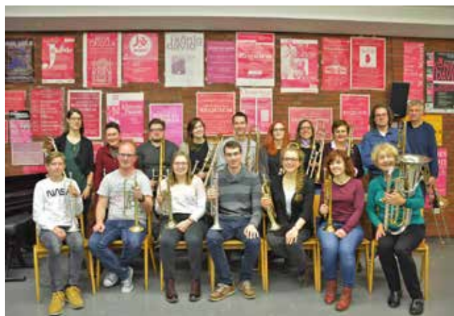
Foto links: Im Coronajahr waren gesellige Zusammenkünfte des Posaunenchor in der Regel nicht möglich. Erfunden wurde darum die Online-Kneipe, bei der man virtuell miteinander anstieß. Foto rechts: Im Jahr 2020 war der Posaunenchor gewachsen und wuchs trotz Pandemie danach weiter.

machen den Chor zu dem, was er ist: eine fröhliche, aufgeschlossene und kontaktfreudige Schar Menschen jeglichen Alters.