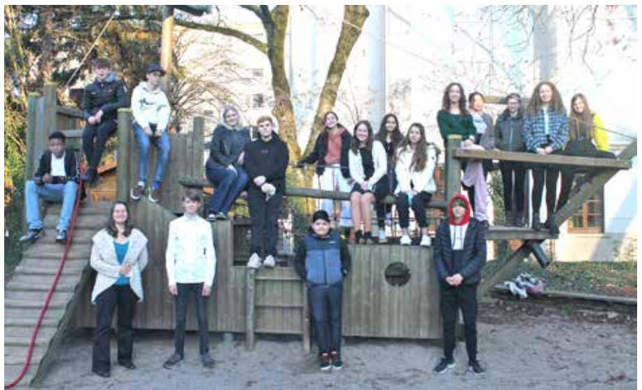
Der Konfirmandenjahrgang 2020/2021