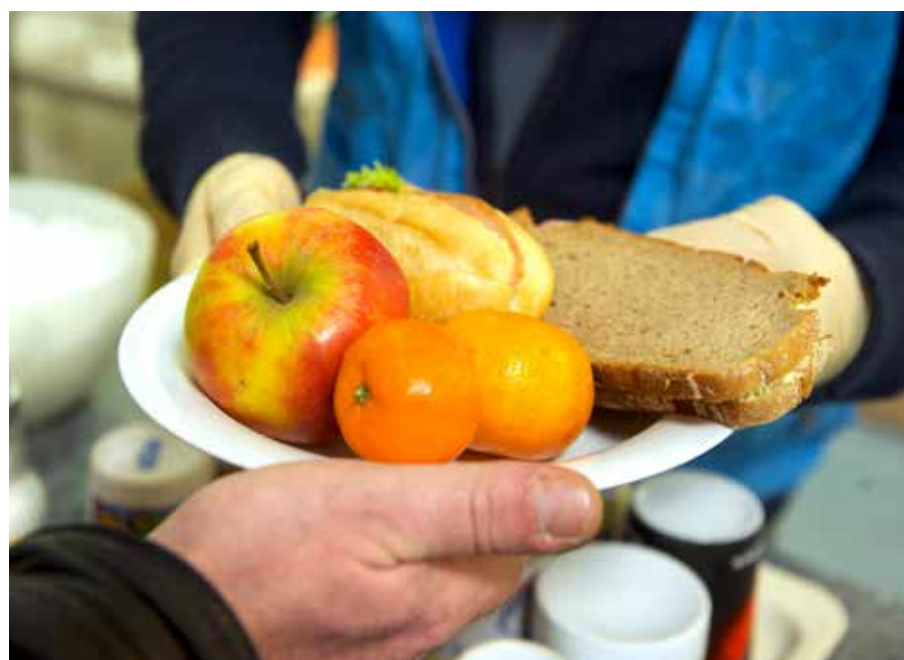
Dieses Jahr war bei der Sonntagseinladung alles anders.