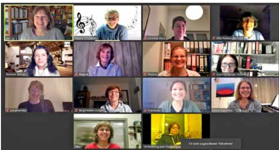
Altprobe der Melanchthonkantorei im Zeichen von Corona.

Das traditionelle Musikwelten-Winterkonzert in der Diakoniekirche Luther findet in diesem Jahr online statt. Ab Mitte März gibt es das Video bei YouTube, auch über unsere Homepage. Als Vorgeschmack gibt es einen Ausschnitt aus dem Konzert 2020 auf der Website: www.neckarstadtgemeinde.de