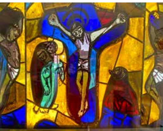
Passionsfenster im Gemeinderaum Wohlgelegen