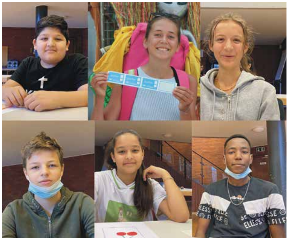
Die „restlichen“ sechs Konfis, die in der letzten Ausgabe des Gemeindebriefs noch nicht abgebildet waren.

Bilder von Eurer Konfirmation findet Ihr auf der Homepage: www.neckarstadtgemeinde.de