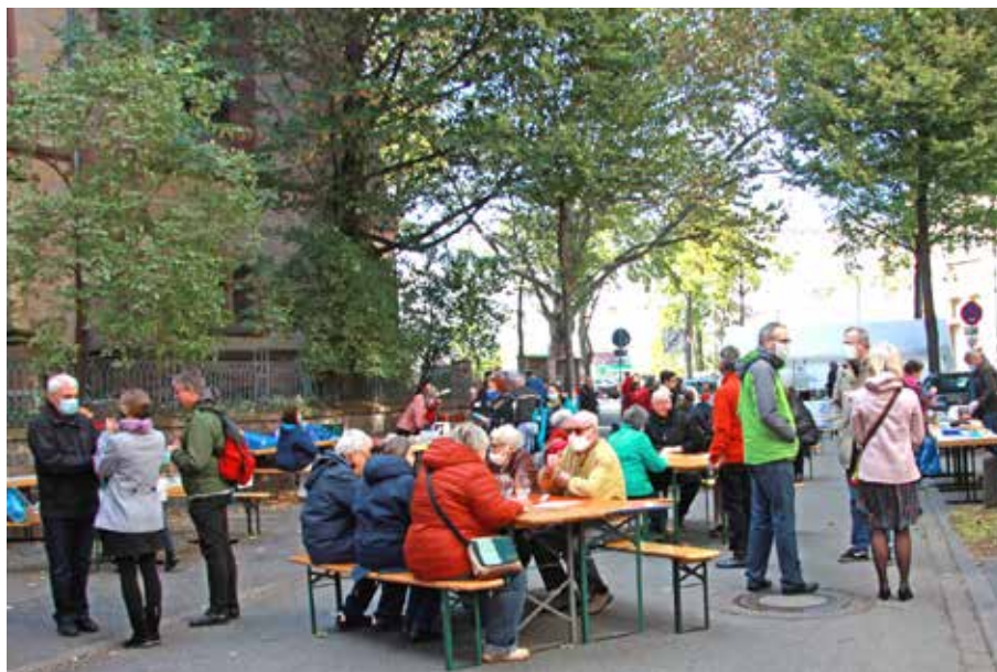
Bei wunderbarem Herbstwetter feierten viele unser Gemeindefest zum 10 jährigen Jubiläum der Diakoniekirche Luther drinnen und draußen mit.

Darüber hinaus hat der Ältestenkreis in den Gesprächen mit dem Diakonischen Werk die Bereitschaft signalisiert, über eine andere Aufteilung der Finanzierung und alternative Formate der Zusammenarbeit nachzudenken. Dabei steht für den Ältestenkreis fest: eine kirchliche Arbeit in der Neckarstadt-West ist ohne einen sozialdiakonischen Schwerpunkt nicht vorstellbar. Kinderkaufhaus, Mannheimer Arbeitslosenzentrum, Sozialberatung usw. genießen eine hohe Akzeptanz, und die Kooperation von Angeboten der Gemeinde und des DW unter einem Dach ist ein Erfolgsmodell, das – unter welchen Bedingungen auch immer – weitergeführt werden muss!