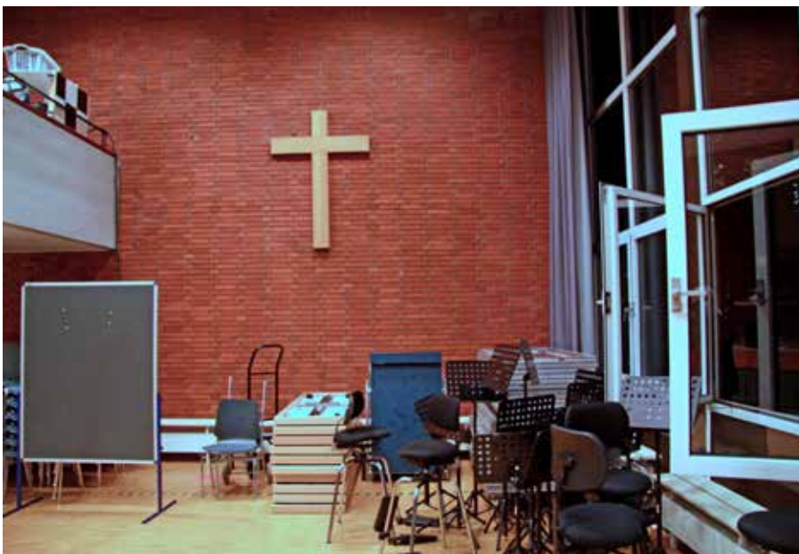
Schon jetzt sind die Räume der Neckarstadtgemeinde im Ausnahmezustand. Das Foto zeigt eine Ecke des Melanchthonsaales mit gestapelten Tischen, Stühlen und Notenständern – während der Abendveranstaltung. Es fehlt Platz.

Den ausführlichen Bericht vom 31.10. finden Sie im Neckarstadtblog unseres geschätzten Redakteurs Johannes Paesler unter www.facebook.com/100jahre .