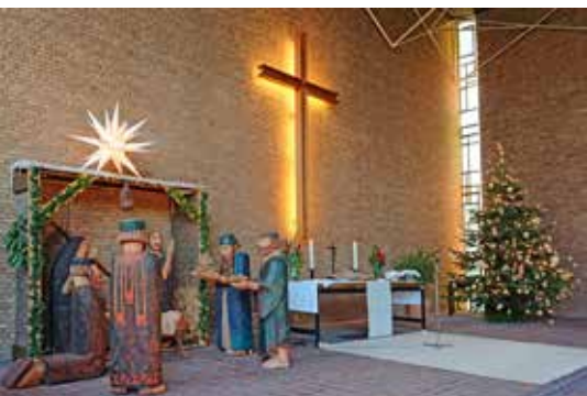
Weihnachtskrippe in der Paul-Gerhardt-Kirche