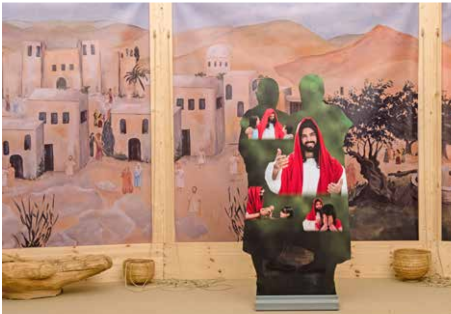
Inszenierte Reise durch Raum und Zeit in das Land Israel vor rund 2000 Jahren

Donnerstag, 19. März, 16:00 Uhr, Melanchthonkirche