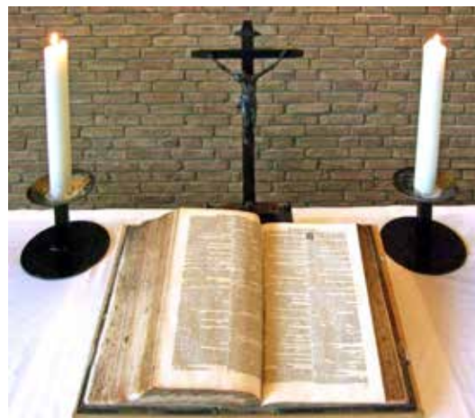
Altarbibel in der Paul-Gerhardt-Kirche aus dem Jahr 1716