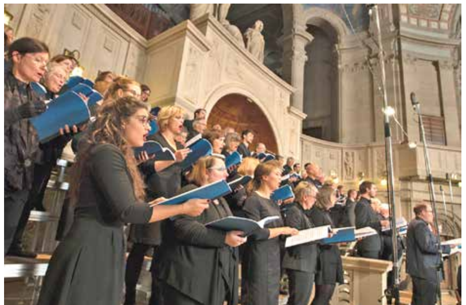
Die Melanchthoncantorei in der Christuskirche am 21. Oktober 2018

Sonntag, 17. Mai, 17:00 Uhr Christuskirche Oststadt