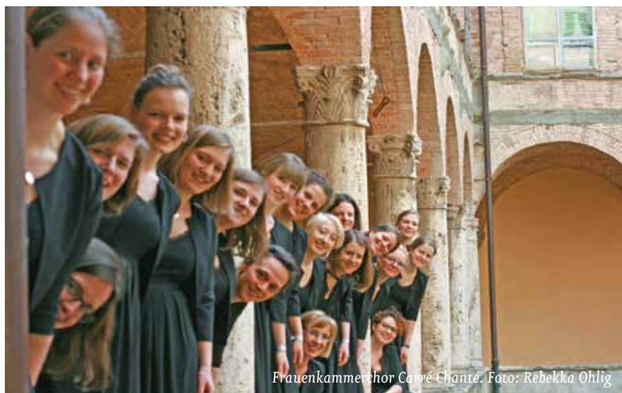
Frauenkammerchor Carré Chanté.

Samstag, 25. April, 20:00 Uhr Diakoniekirche Luther