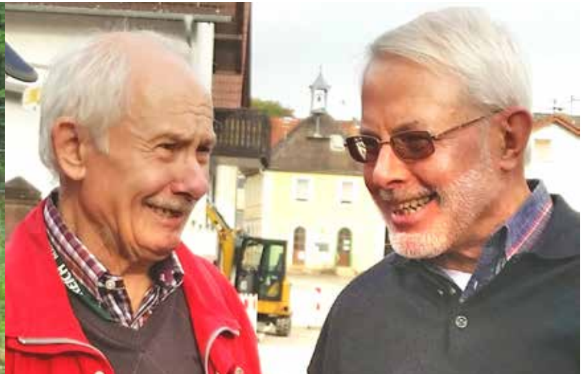
Lange Jahre ein gutes Team, Foto: privat