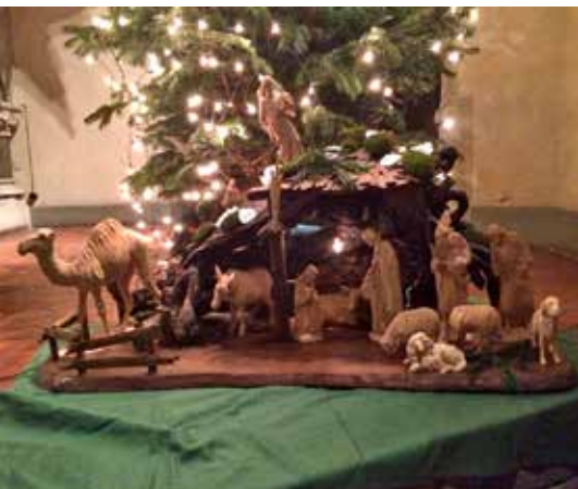
Weihnachtskrippe in der Diakoniekirche Luther