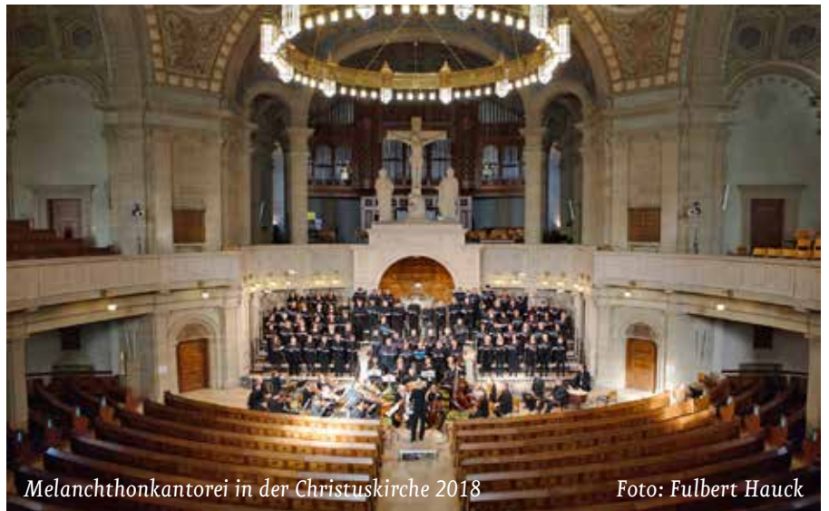
Melanchthonkantorei in der Christuskirche 2018