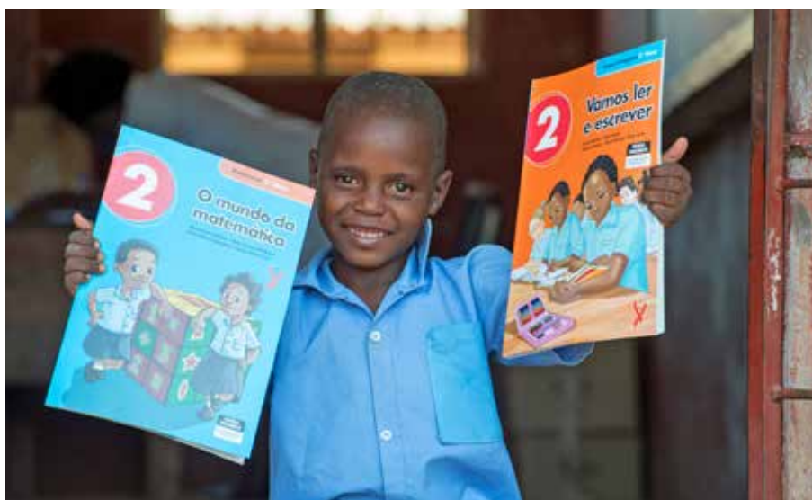
Dass die Kinder in der der Umgebung der Müllhalde Hulene zur Schule gehen können, verdanken sie der Partnerorganisation Renascer-OMAC