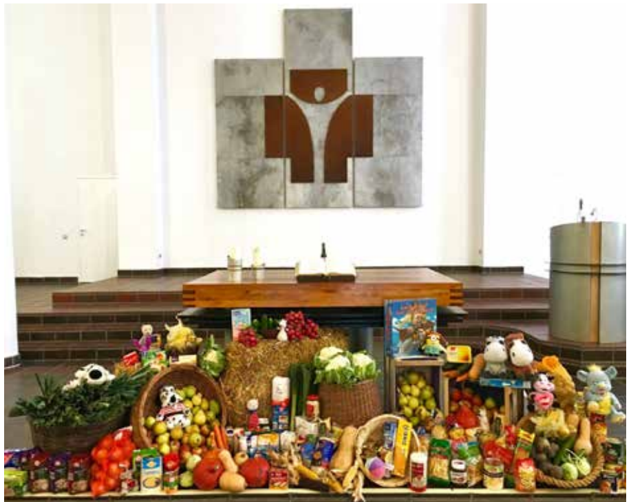
Die Kitas in der Neckarstadtgemeinde denken besonders an die Armen, die Nahrung brauchen für den Körper und die Seele.

Sonntag, 6. Oktober, 10:00 Uhr, Melanchthonkirche