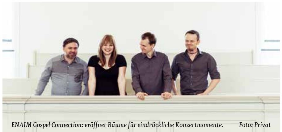
ENAIM Gospel Connection: eröffnet Räume für eindruckliche Konzertmomente.

Sonntag, 13. Oktober, 10:00 Uhr Gottesdienst, 11:30 Uhr Matinee Melanchthonkirche