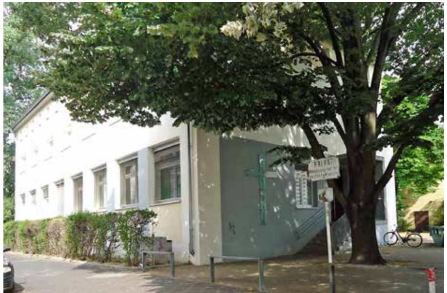
Die Kindertagesstätte Paul-Gerhardt-Straße

Zusammen mit dem Flötenensemble der Melanchthonkirche führen wir an Heiligabend die „Weihnachtsgeschichte“ von Carl Orff auf.