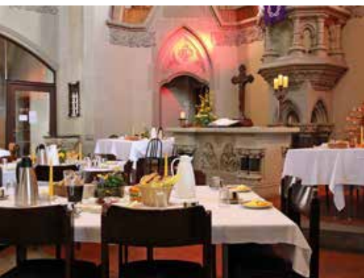
Die Tische sind gedeckt. Herzliche Einladung zum Gottesdienst plus Croissants an der Diakoniekirche Luther