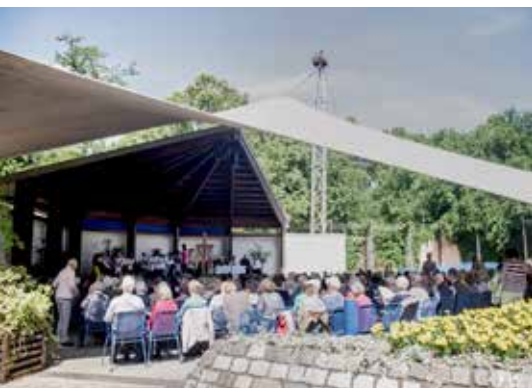
Ökumenischer Pfingstgottesdienst in der Konzertmuschel