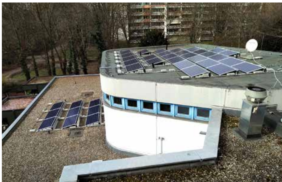
Die Photovoltaikanlage auf dem Dach der Kita

Die Anlage wurde von der Ökumenischen Energiegenossenschaft Baden-Württemberg e.G. errichtet und von der Evangelischen Kirche Mannheim für einen Zeitraum von 20 Jahren gemietet.