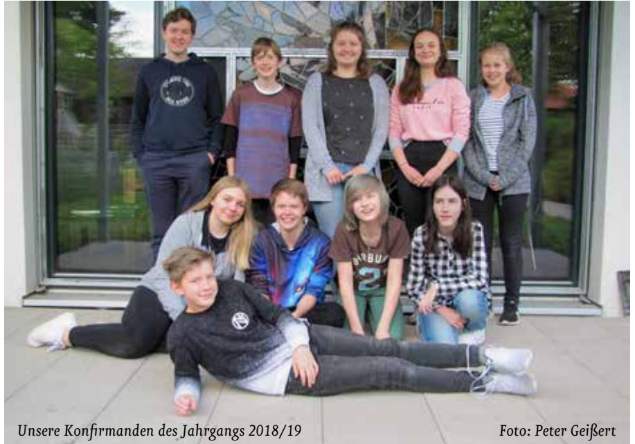
Unsere Konfirmanden des Jahrgangs 2018/19

Info-Abend zum Konfi-Kurs 2019/20 Dienstag, 25. Juni, 18:00 bis 19:00 Uhr, Melanchthonhaus, Großer Saal