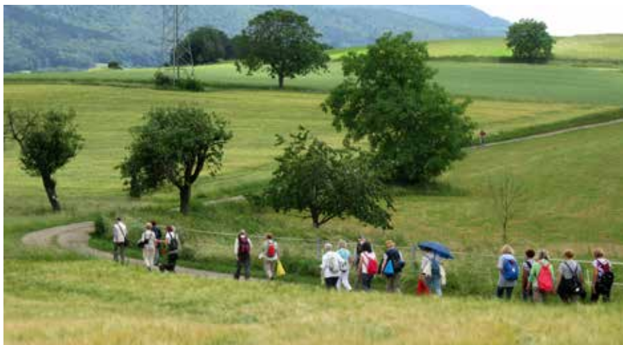
Das Wandergruppe ist unterwegs auf dem Kunstweg von Lindenfels nach Fürth.