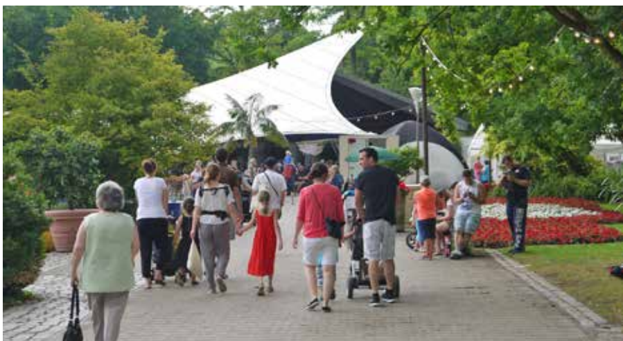
Auf dem Weg zur Konzertmuschel

Montag, 1. Juli, 19:00 Uhr Paul-Gerhardt-Kirche