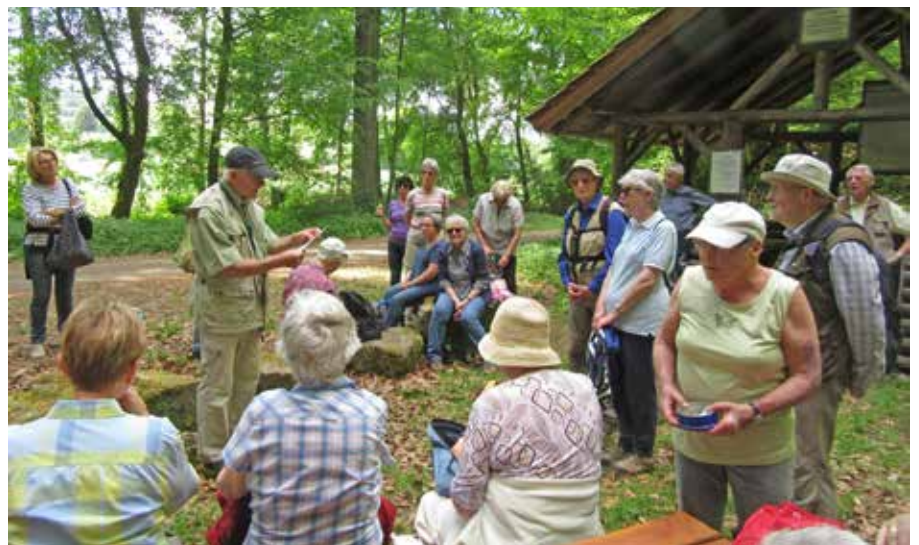
Nach einer Pause wird jetzt wieder gewandert.