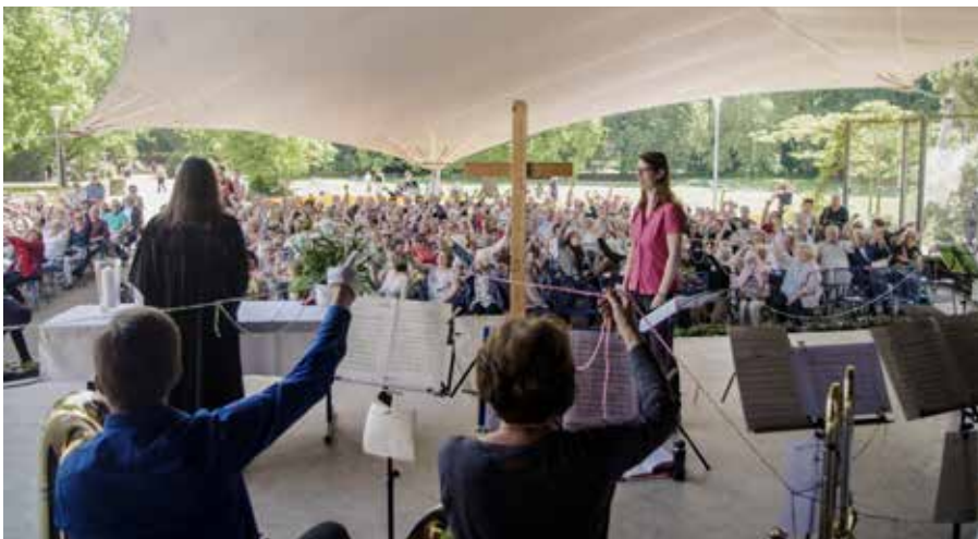
Ökumenischer Gottesdienst in der Konzertmuschel

Pfingstmontag, 10. Juni 11:00 Uhr, Herzogenriedpark