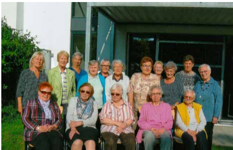
Wir feierten unser 40-jähriges Bestehen.