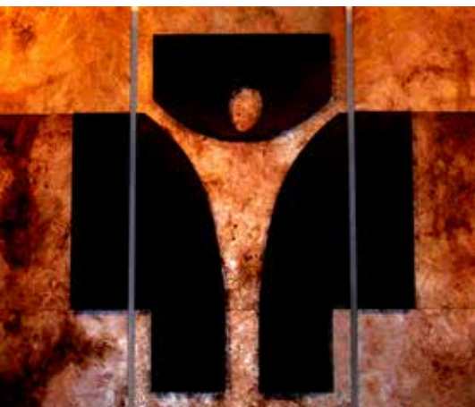
„Der Gekreuzigte ist der Auferstandene“ – Altarwandbild in der Melanchthonkirche von Hannelore Pichlbaur