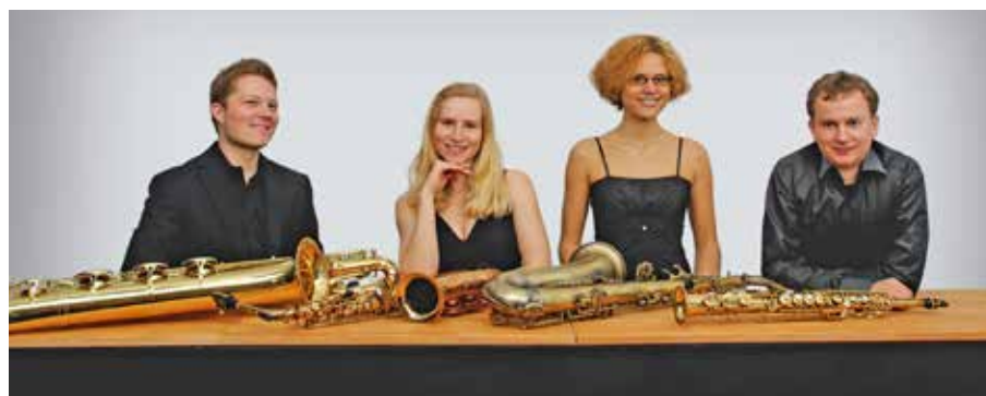
Das Saxophon-Quartett Kolibri

Sonntag, 2. Dezember , 1. Advent, 11:30 Uhr, Melanchthonkirche