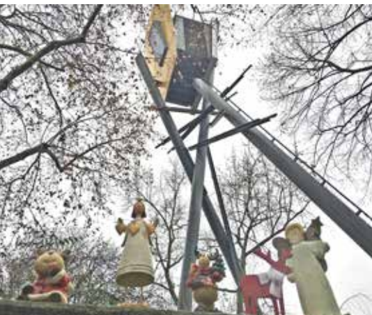
Die Kirchengemeinde wurde vergangenes Jahr von einem originellen Adventsgruß zu Füßen des Glockenturms überrascht; die Figuren standen plötzlich einfach da und verschwanden auch von allein. Viele hatten ihre Freude daran.