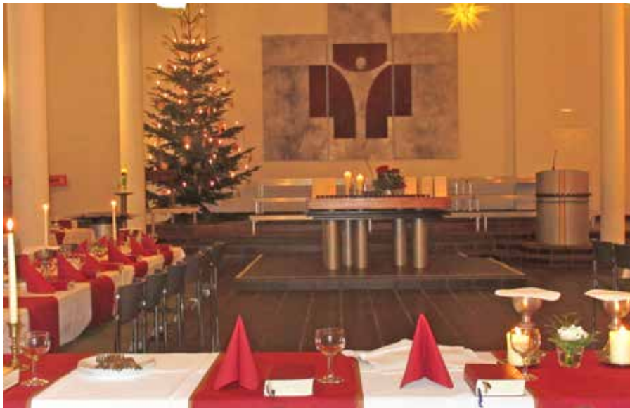
Einladung zum Feierabendmahl in der festlich geschmückten Melanchthonkirche

Freitag, 11. Januar, 19:00 Uhr, Melanchthonkirche