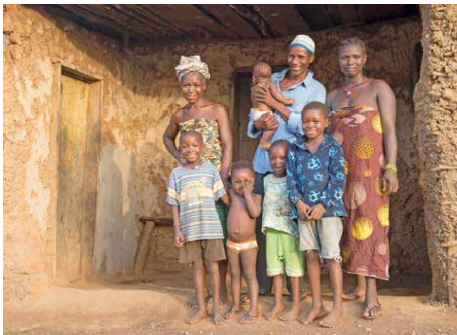
Ein Projekt unter Beteiligung von Brot für die Welt ermöglicht Jungen und Mädchen in Sierra Leone, in die Schule zu gehen.

Brot für die Welt: Sierra Leone – Schule statt Kinderarbeit. Bank für Kirche und Diakonie, IBAN: DE10 1006 1006 0500 5005 00