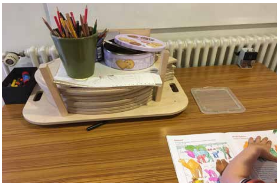
So sieht unsere Kinderecke im Moment aus. Wir wünschen uns, dass sie schöner und einladender wird.

zen. Der Keim dafür wird in den Kinderjahren gelegt. Darum herzlich willkommen im Sonntagsgottesdienst und natürlich bei jedem Familiengottesdienst.