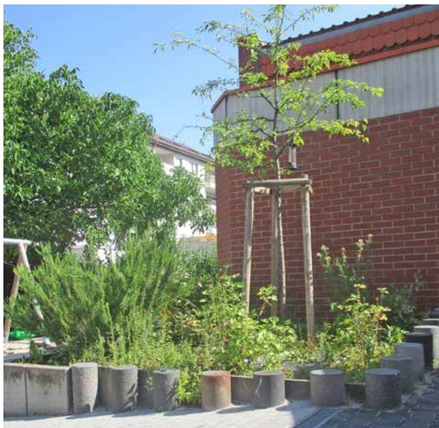
Bald geht es los: Hier soll unser Nutzgarten entstehen.

Die Erzieherinnen aus der Kita Käfertalerstraße