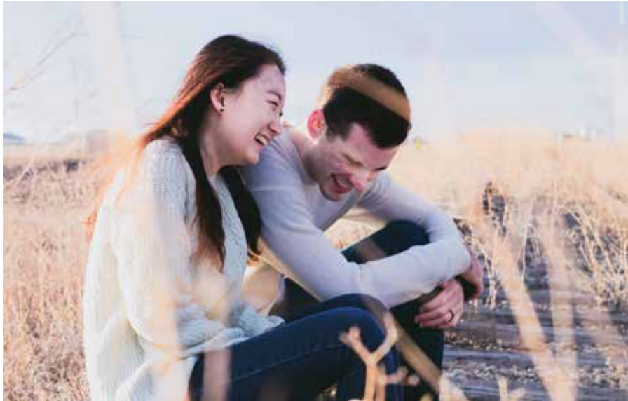
Gemeinsames Lachen entspannt

Sonntag, 14. Oktober, 11:00 Uhr, Diakoniekirche Luther