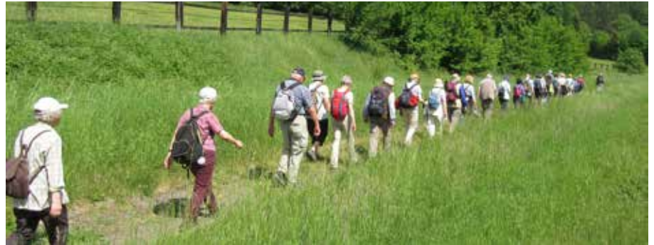
Das Wandergrupp- le auf einem schmalen Weg von Zuzenhausen nach Hoffenheim