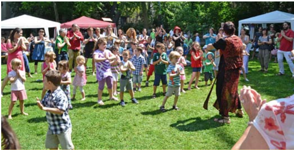
Fröhlich feiern wir Pfingsten den Geburtstag der Kirche.

Sonntag, 4. Juni, 11:00 Uhr Melanchthonwiese