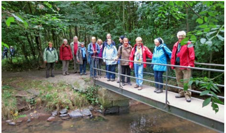
Auf der Brücke über den Speyerbach bei Haßloch: Los geht's ins neue Wanderjahr.