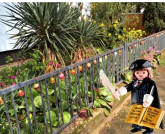
Wir laden Sie ein, den Osterweg mitzugehen.