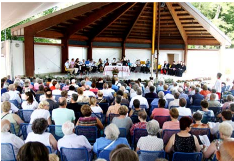
Ökumenischer Pfingstgottesdienst im Herzogenriedpark

Sonntag, 5. März, 10:00 Uhr Melancthonkirche Gottesdienst zum Abschluss des Weltgebetstags-Wochenendes