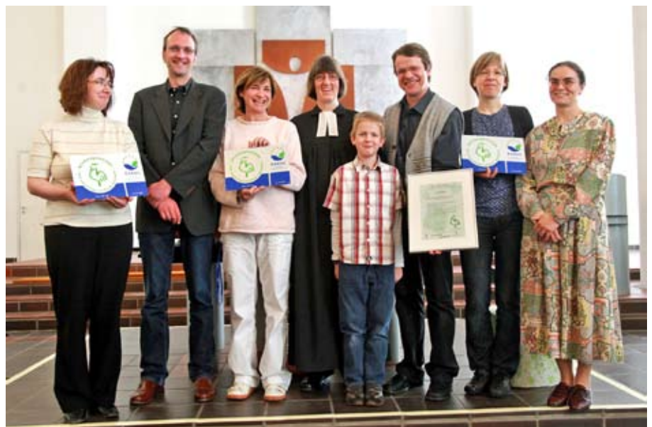
In einem Festgottesdienst wurde am 25. Mai 2009 die Zertifizierungsurkunde übergeben.