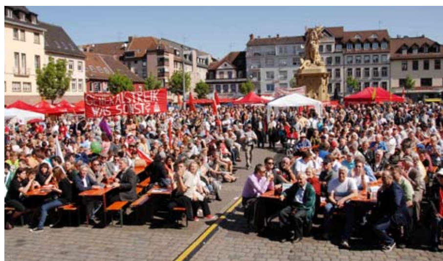
Die Kundgebung zum 1. Mai beginnt mit einem ökumenischen Gottesdienst in der Marktkirche St. Sebastian, 9:00 Uhr.