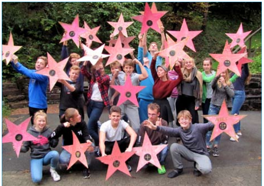
Konfi-Wochenende im Odenwald: „Walk of Fame“ – du bist der Star!