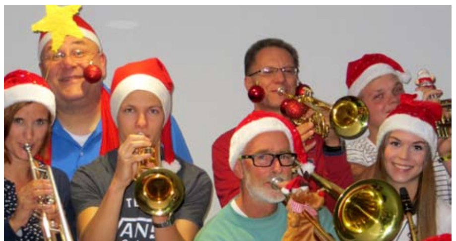
Jauchzet und frohlocket in vollen Tnen mit der Blue Bird Big Band

Sonntag, 4. Dezember, 17:00 Uhr, Diakoniekirche Luther