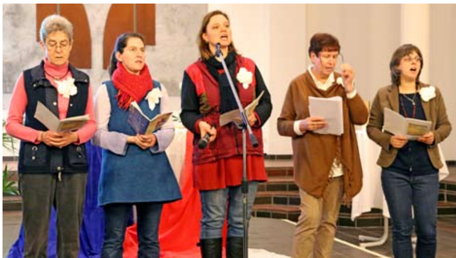
Beim Weltgebetstag 2016 begeisterten Lieder aus Kuba.

Gottesdienst: Freitag, 3. März 19:00 Uhr Melanchthonkirche