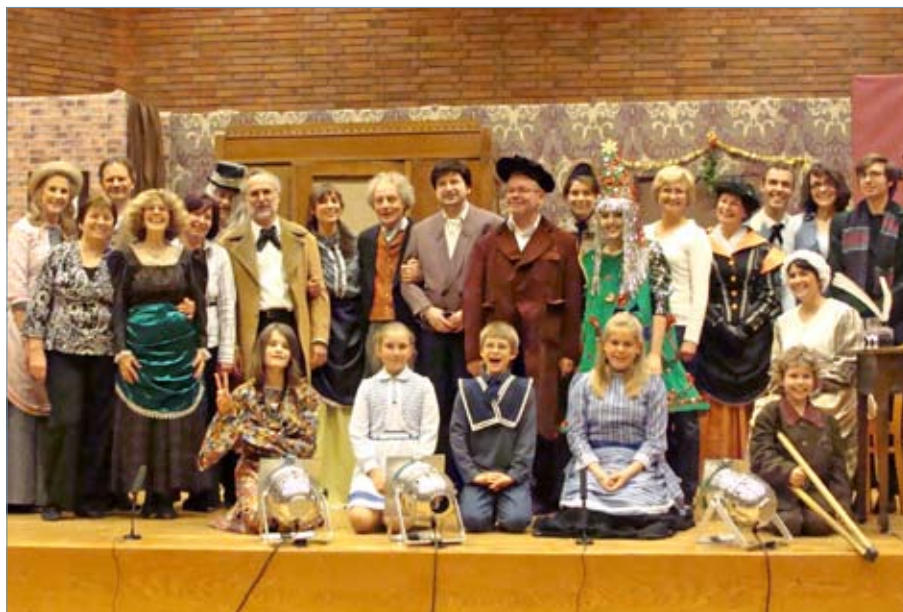
Theaterbegeistert und -begeisternd: Melanthalia, die atemberaubende Theatergruppe unserer Gemeinde.

Melanthalia 20 Jahre, 40 Aktive und jetzt sogar die Künstlerfreiheit