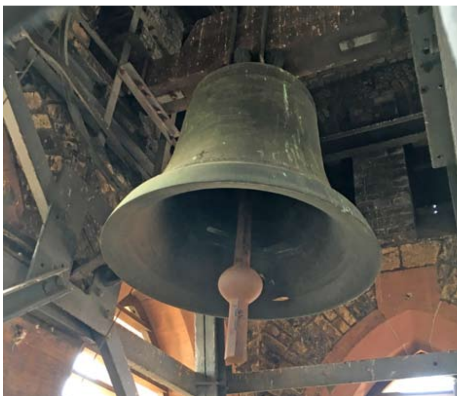
Sie soll im Reformationsjahr wieder läuten können: die größte Glocke im Turm der Lutherkirche.

Evangelische Gemeinde in der Neckarstadt, Sparkasse Rhein Neckar Nord, IBAN: DE75 6705 0505 0030 2909 76, Stichwort: „Glocken für Luther“