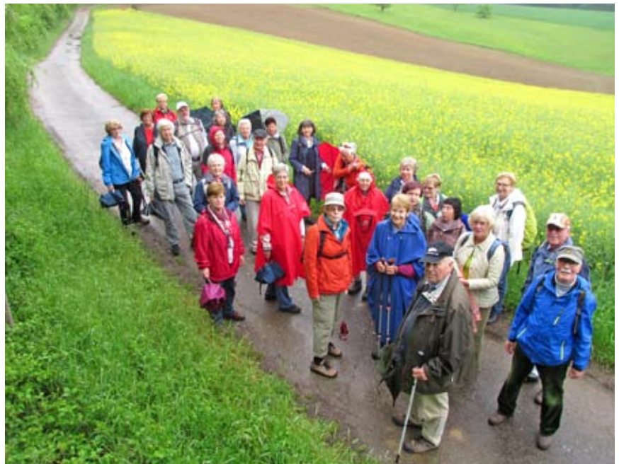
's Melancthon Wandergruppe wartet auf einer Wanderung nach Neidenstein – und alle, die wieder mitwandern möchten, müssen nun warten bis zum März, dann wird wieder gewandert.

Wir freuen uns auf rege Teilnahme und wünschen allen eine gesegnete Adventszeit.