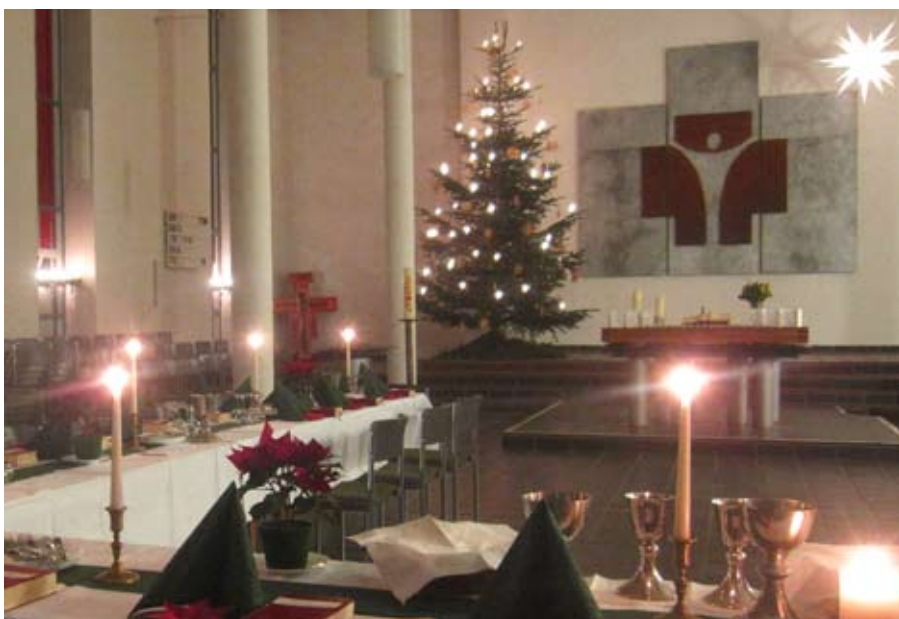
Einladung zum Feierabendmahl in der festlich geschmückten Melanchthonkirche

Freitag, 13. Januar, 19:00 Uhr Melanchthonkirche