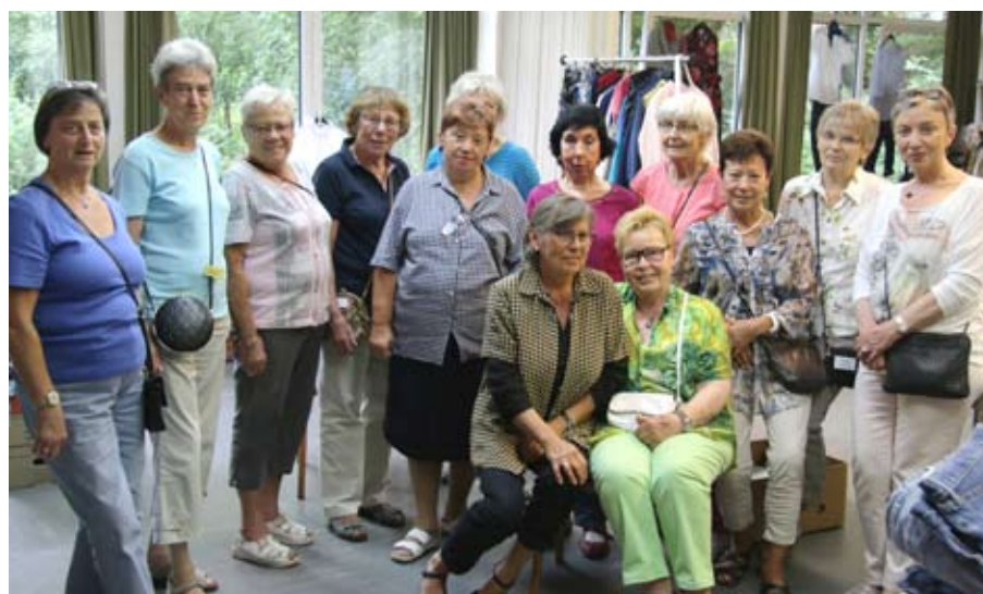
Eine tolle Truppe, seit 16 Jahren einfühlsam und beratend aktiv