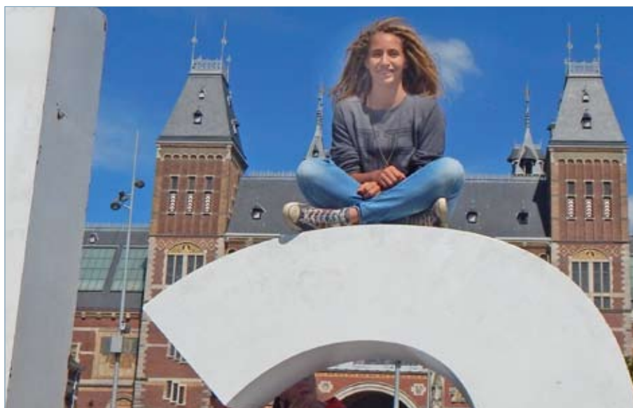
Die Teamerin wechselt in ein neues Team.