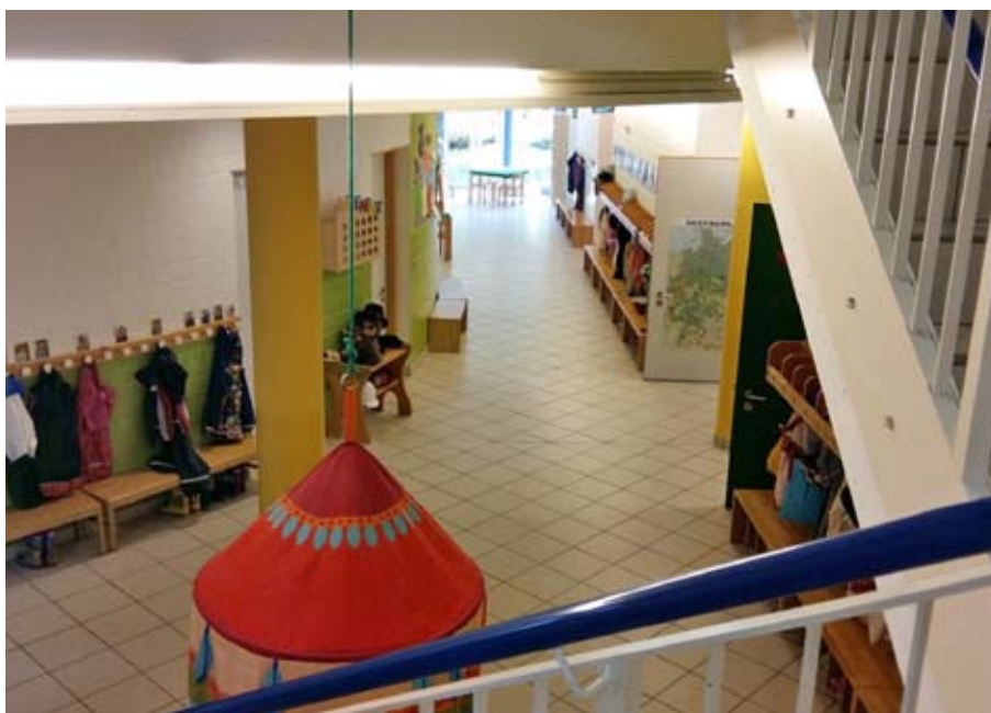
Am Weiterbildungstag ist es ohne Kinder ganz still und ruhig im Kindergarten.