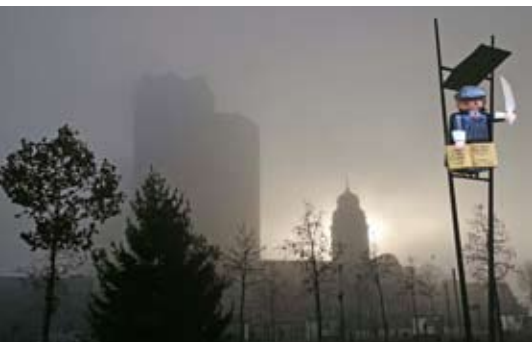
Manchmal hilft ein Perspektivwechsel, um den Überblick zu behalten.

Vielleicht bieten Ihnen die Nebeltage in diesem Jahr Gelegen-