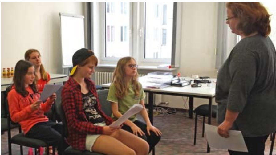
Engagierte JungschauspielerInnen studieren ihre Rollen ein.

Dann ausrollen und beliebige Formen ausstechen. Auf ein Backblech legen und bei 180 Grad im vorgeheizten Backofen 15 Minuten backen.