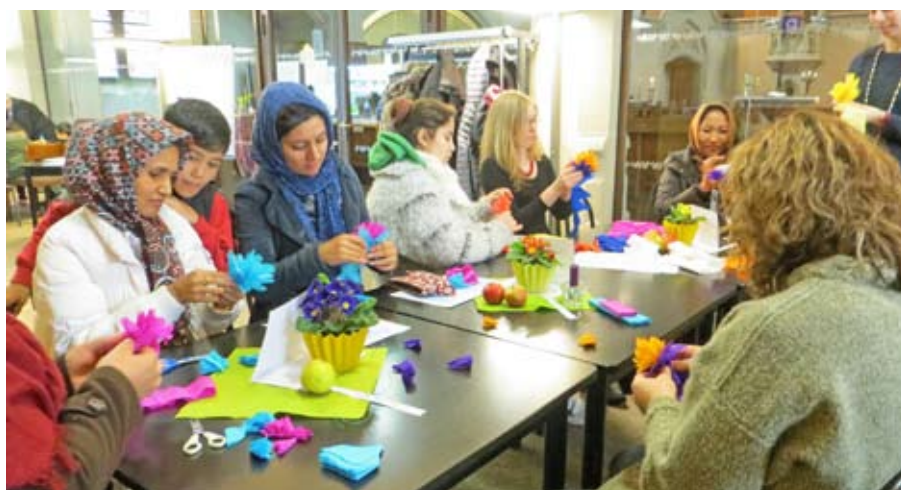
Offenes Begegnungscafé: Frauen unterschiedlicher Herkunft sind gemeinsam kreativ.

Hinter den beiden Frauennamen verbirgt sich ein offener Begegnungstreff zum geselligen Austausch von Frauen aus verschiedenen Herkunftsländern. Der Treff wird von ehrenamtlichen Mitarbeiterinnen mit Unterstützung durch die Sozialarbeiterinnen der Caritas geleitet. Anfangs vorrangig zur Unterstützung der Frauen aus der Flüchtlingsunterkunft in der Industrie-