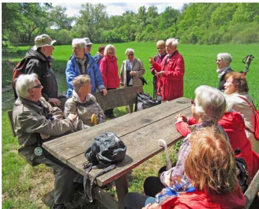
Wanderpause im Naturschutzgebiet Erdekaut