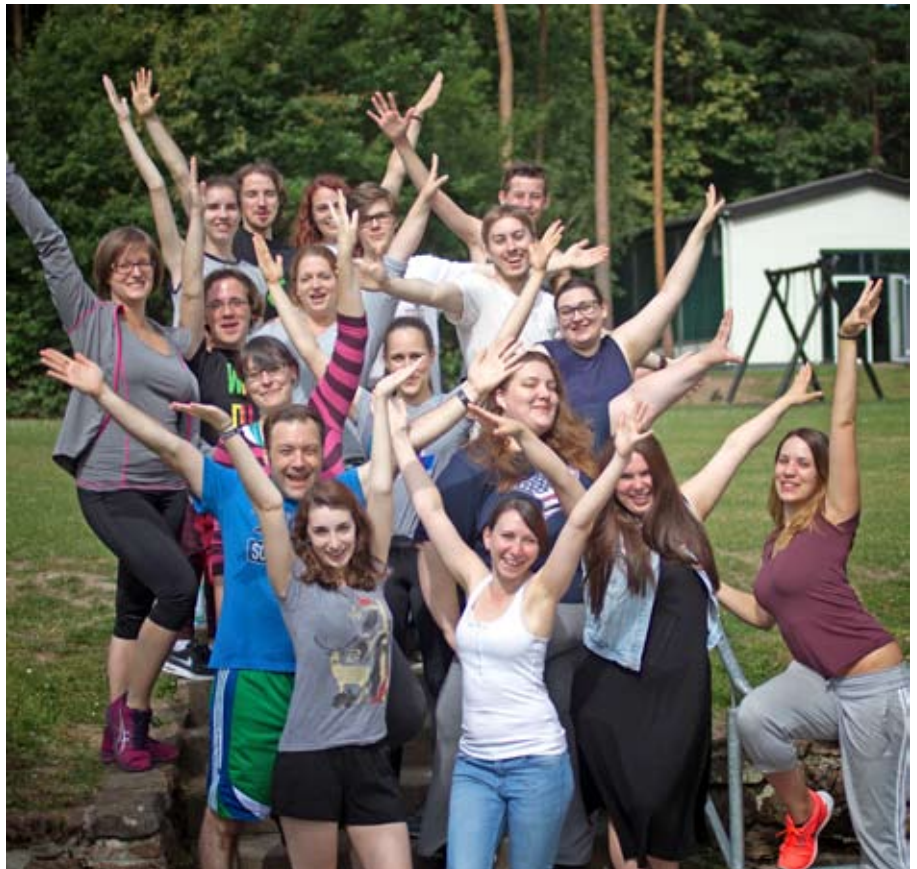
Der Popchor probt sein neues Programm.

Donnerstag, 3. November , 20:00 Uhr (Premiere), Freitag, 4. November , 20:00 Uhr, Samstag, 5. November , 17:00 Uhr, Freitag, 11. November , 20:00 Uhr, Samstag, 12. November , 17:00 Uhr, Melanchthonhaus