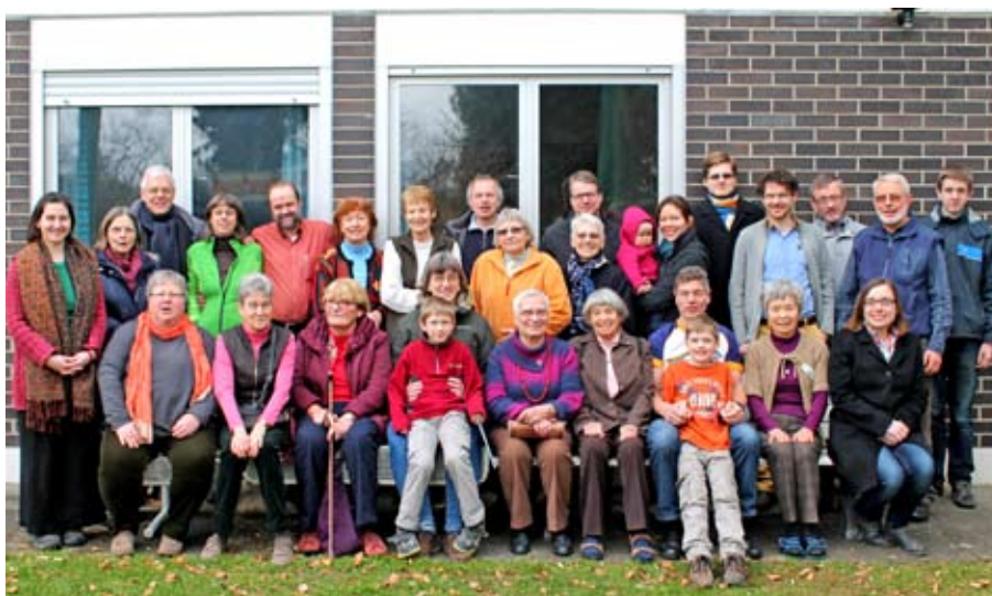
Die fröhlichen Teilnehmerinnen und Teilnehmer am Ende des Gemeindewochenendes im Februar 2015

17. bis 19. Februar 2017 Weinheim-Ritschweier