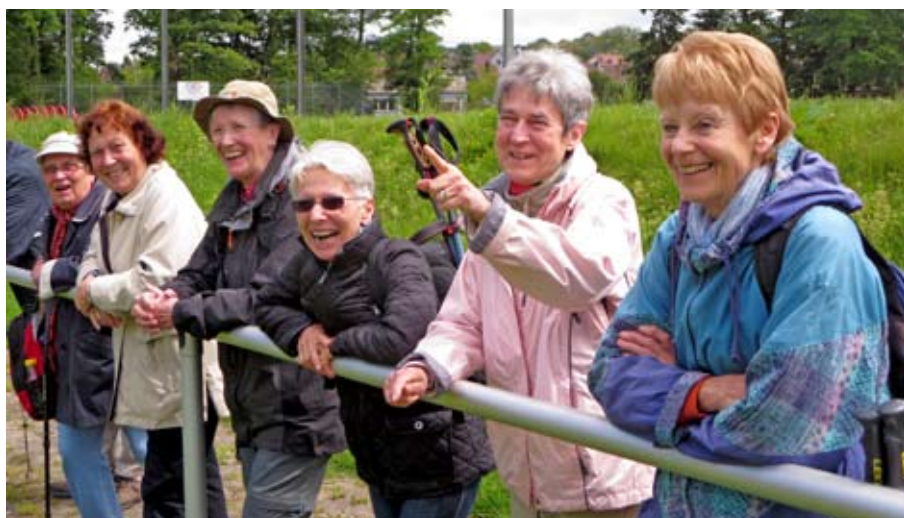
Ein Wandergrüpple-Fußballspiel – da gibt es für die Zuschauerinnen viel zu lachen.