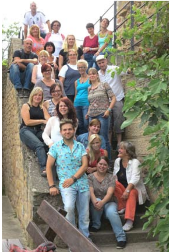
Das Team der Kindertagesstätte Am Brunnengarten (Krümelchen)

ich an den Kindern, die tagtäglich unser Haus mit Leben füllen. Die Kinder und ihre Familien haben Vertrauen zu euch – und das ist das größte Geschenk, das wir bekommen können.