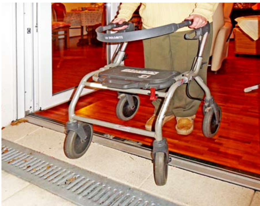
Stufen- und schwellenlose Übergänge erleichtern den Alltag auch bei Mobilitätseinschränkungen.