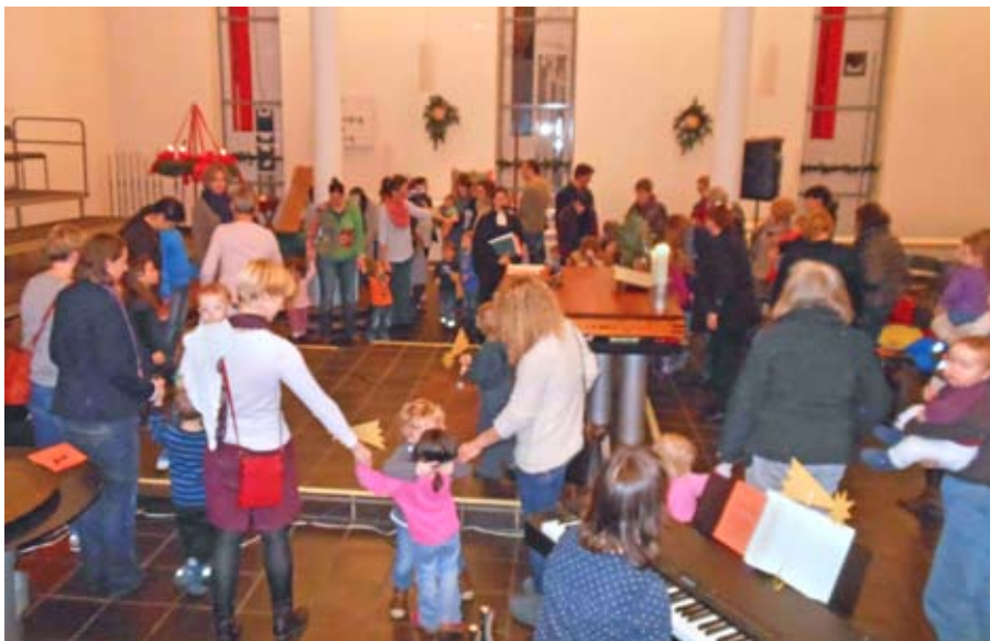
Gottesdienst für kleine Leute mit Geschwistern, Eltern, Großeltern und Paten.

Liebe Eltern, bringt zur zweiten Stunde etwas zu essen mit FÜR ALLE! Samstag, 6. Juni. Thema wird am 9. Mai bekanntgegeben.