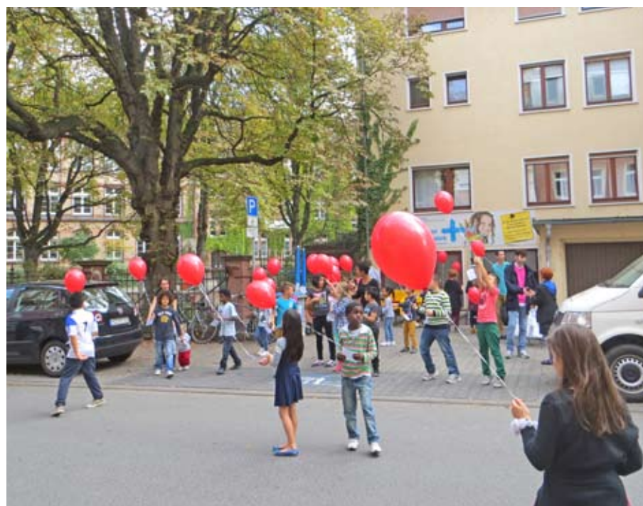
Fröhlicher Luftballonstart bei der Feier zu den erweiterten Öffnungszeiten