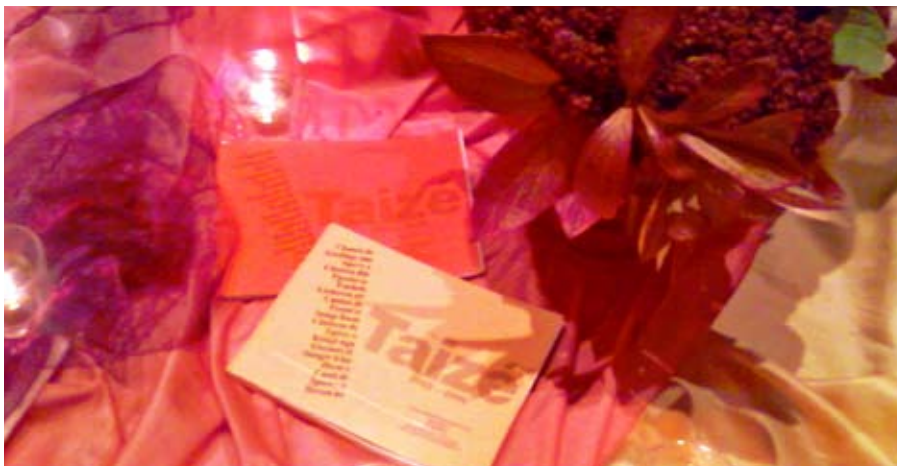
Zeit für Besinnung, Fürbitte und Anbetung

Sonntag, 14. Dezember, 11:00 Uhr, Diakoniekirche