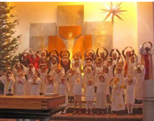
Weihnachten ist Gemeinschaft.

Dieses Kind, Jesus Christus, setzt später sein ganzes Leben dafür ein,