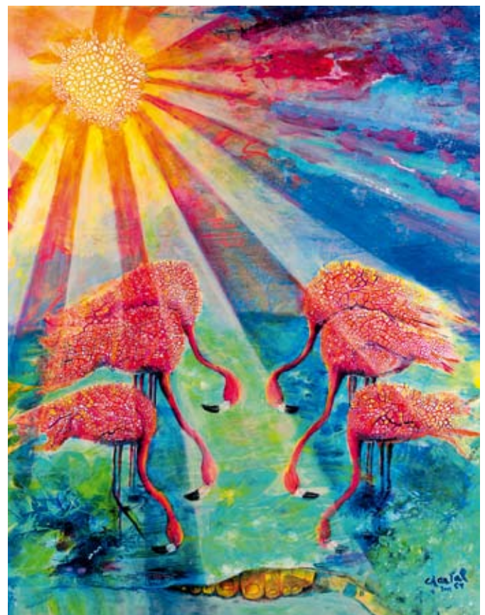
Titelbild zum Weltgebetstag 2015 von den Bahamas, „Blessed“, Chantal E. Y. Bethel/ Bahamas, © Weltgebetstag der Frauen - Deutsches Komitee e.V., www.weltgebetstag.de

Gottesdienst: Freitag, 6. März , 19:00 Uhr, Melanchthonkirche