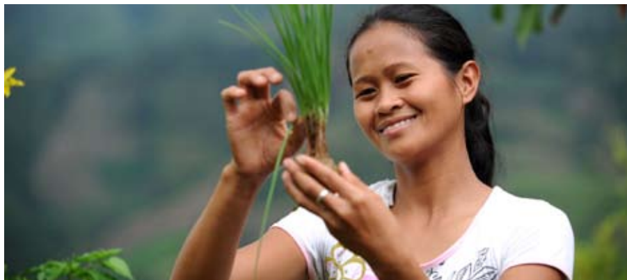
Unsere Landeskirche unterstützt in diesem Jahr besonders zwei Projekte von Brot für die Welt.