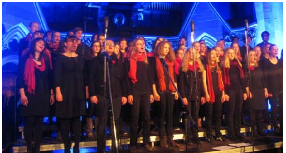
Der Popchor beim Christmas Concert 2012

Freitag, 6. Februar, 18:00 und Samstag, 7. Februar, 17:00 Uhr, Melanchthonhaus