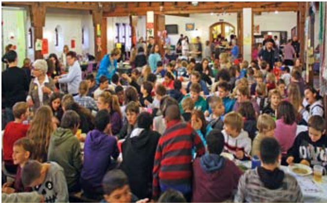
7. Mannheimer KinderVesperkirche in der Jugendkirche vom 1. bis 14. Dezember

6. Januar bis 1. Februar täglich 11:00 bis 15:00 Uhr, Mittagessen bis 14:00 Uhr, CityKirche Konkordien