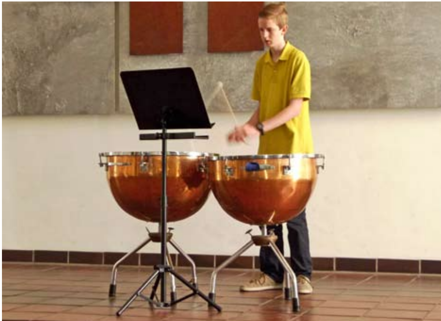
Pauken sind Instrumente für festliche Musik. Die Melanchthonkantorei spart zu ihrem 95. Geburtstag auf neue Pauken, um gut für Feste und Feiern gerüstet zu sein. Unterstützung ist hochwillkommen.

Von den 4.000 Euro Anschaffungskosten fehlen uns noch 1.800 Euro. Wenn Sie uns unterstützen möchten, freuen wir uns über Ihre Spende auf das Konto der Melanchthonkantorei Mannheim, IBAN: DE58 6705 0505 0034 0617 69.