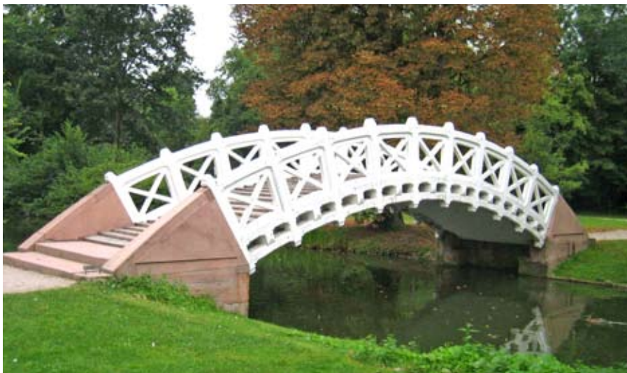
Gelungener Brückenschlag im Schlosspark Schwetzingen

Sonntag, 23. November, 9:30 Uhr, Melanchthonkirche