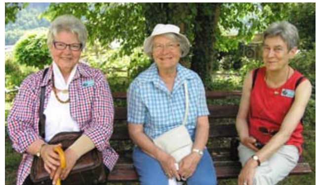
Teilnehmerinnen der Seniorenfreizeit in Schwäbisch Gmünd