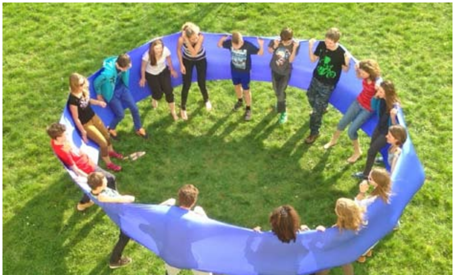
Die Konfis des vorigen Jahrgangs

Der Reformationstag am 31. Oktober und die Lichtmeile am 16. November werden die nächsten Meilensteine auf dem Weg zur Konfirmation am 10. Mai 2015 sein.