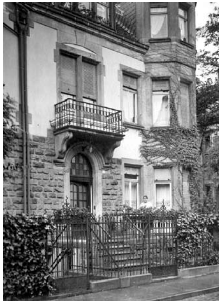
Das Haus Lachnerstraße 12