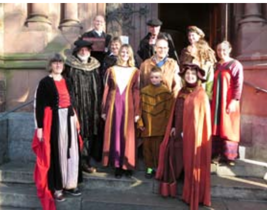
Lutherfest macht Reformation lebendig

Aktuell: Schritte auf dem Weg zu einer Kirche des gerechten Friedens