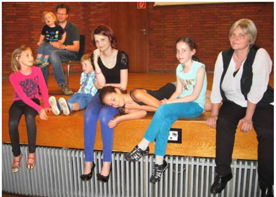
127 Jahre und schon ein bisschen weise: „Die kleine Hexe“ von Otfried Preußler muss sich bei den Großen beweisen. Proben der Melanthalia für die Aufführungen im November.

Freitag, 14. und 21. November und Samstag, 15. und 22. November , jeweils 18:00 Uhr, Sonntag, 16. und 23. November , 17:00 Uhr, Melanchthonhaus