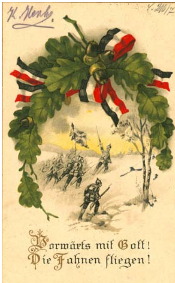
Diese Feldpostkarte aus dem Ersten Weltkrieg illustriert das enge Verhältnis von Kirche, Religion und Staat.