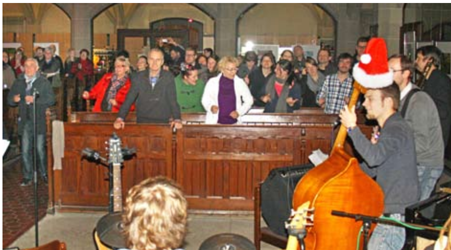
Bei der Xmas Night der Jugend konnte sich keiner mehr auf den Bänken halten.

Zum Abschluss feierten alle gemeinsam einen fulminanten Christmas-Gottesdienst. Rockige Weihnachtslieder der Band „Juri's Kitchen“ heizten der Gemeinde ein. Beim Abschlusslied konnte