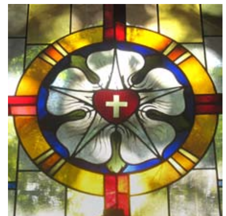
Die Lutherrose über dem Portal der Lutherkirche