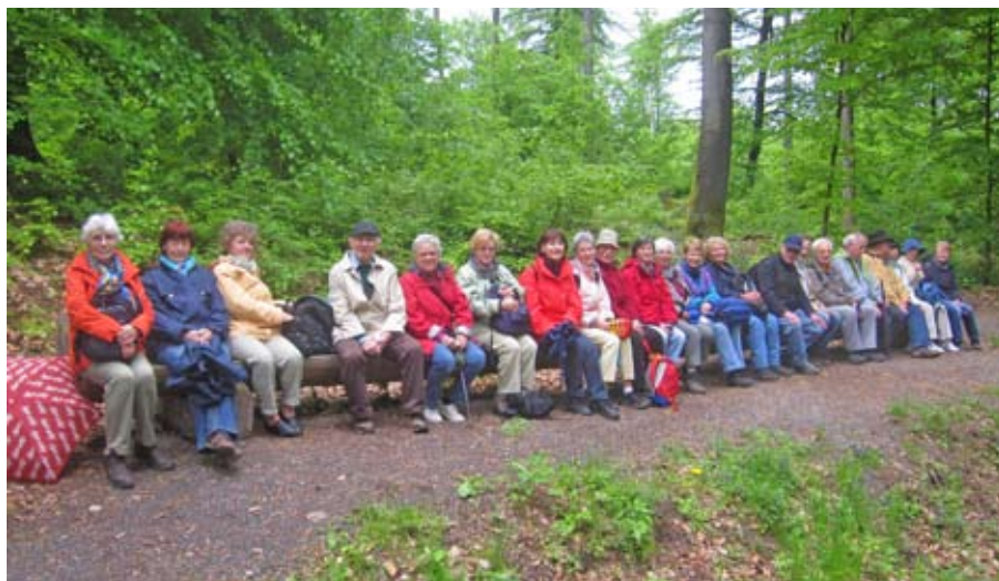
Man muss das Wandergrüpple nicht auf die lange Bank schieben – da saß es schon bei einer Wanderung nach Neckargemünd.