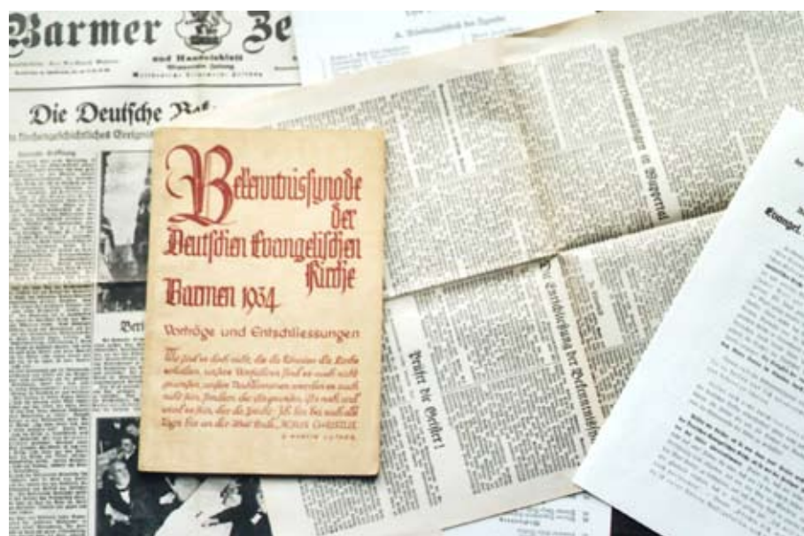
Zeugnisse der Bekenntnissynode in der Gemarker Kirche in Wuppertal-Barmen

im Amtseid der Regierenden und in der Verfassung für die Europäische Union. Den engagierten Christinnen und Christen unter uns sei aber auch gesagt: an Gottes Reich und Gerechtigkeit zu erinnern heißt, allgemein verständlich und rational zu argumentieren, nicht in ei-