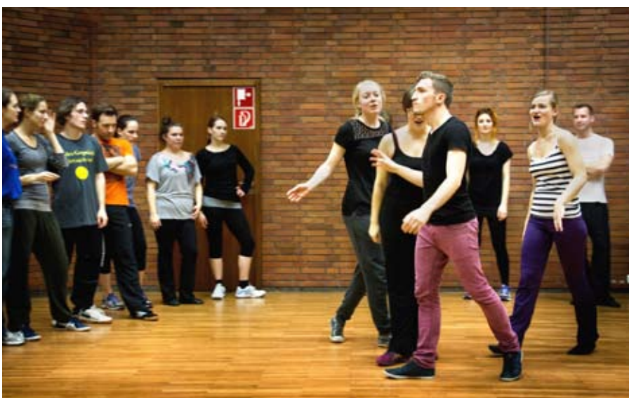
Professionelle Performance braucht viel Übung. Aus den Proben zu Footloose .

Freitag, 6. Juni, 18:00 Uhr, Melanchthonkirche – Herz-Jesu-Kirche – Lutherkirche