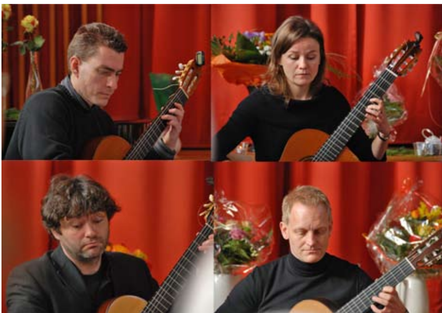
Das Heidelberger Gitarrenquartett präsentiert Musik von der Renaissance bis in die Moderne, hoffentlich ganz ohne schnarrende Saiten. (zum nebenstehenden Text)

Sonntag, 23. Februar, 11:00 Uhr, Melanchthonkirche