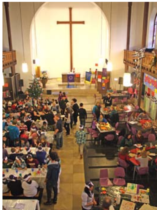
Essen, Gemeinschaft und Kreativität bei der KinderVesperkirche in der Jugendkirche

Benefizkonzert gehören inzwischen fest dazu. Das ganze Jahr über gibt es in der Jugendkirche einen regelmäßigen Mittwochs-Mittagstisch für rund 50 Kinder. In Mannheim sind ca. 9.000 Kinder von Armut betroffen, noch einmal so viele leben in Familien mit geringem Einkommen. Was an den einzelnen Terminen geboten wird, erfahren Sie im Gemeindebüro oder im Kinderkaufhaus an der Lutherkirche. Kirsten de Vos