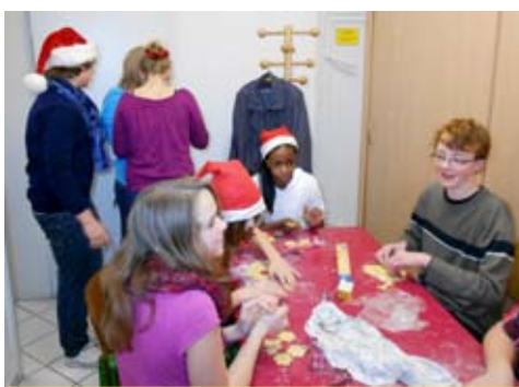
Backstage bei der Xmas Night 2011

Samstag, 21. Dezember, 18:00 bis 23:00 Uhr Lutherkirche