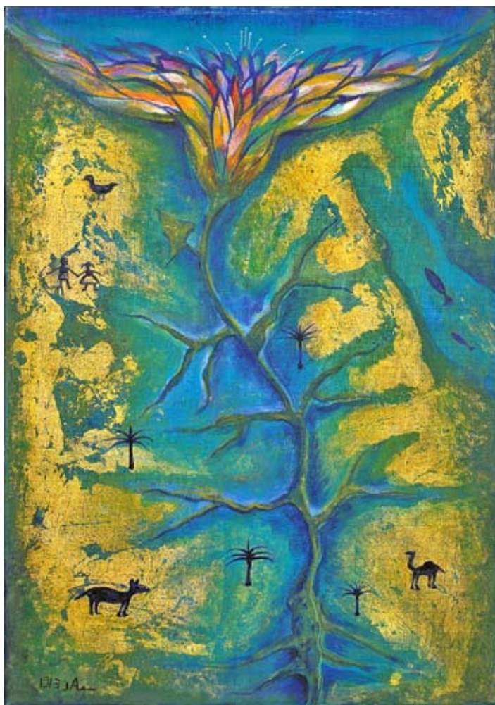
Titelbild zum Weltgebetstag 2014 „Wasserströme in der Wüste“ Souad Abdelrasoul/Ägypten

Samstag, 8. März 17:00 Uhr bis Sonntag, 9. März, 10:30 Uhr Kinderkirchennacht: Reiseziel Ägypten