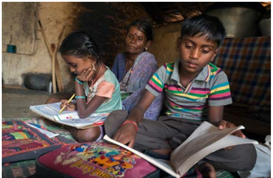
Mit Solarlampen sind in Karnataka auch abends die Hütten hell und frei von giftigem Gestank der Kerosinlampen.

Beide Projekte sorgen dafür, dass es vielen Menschen besser geht. Ganz konkret. Helfen Sie mit durch Ihre Spende! Konto Nr. 4600, Evangelische Kreditgenossenschaft Kassel, BLZ 520 604 10, IBAN DE 95 5206 0410 0000 00 46 00, BIC GENODEF1EK1