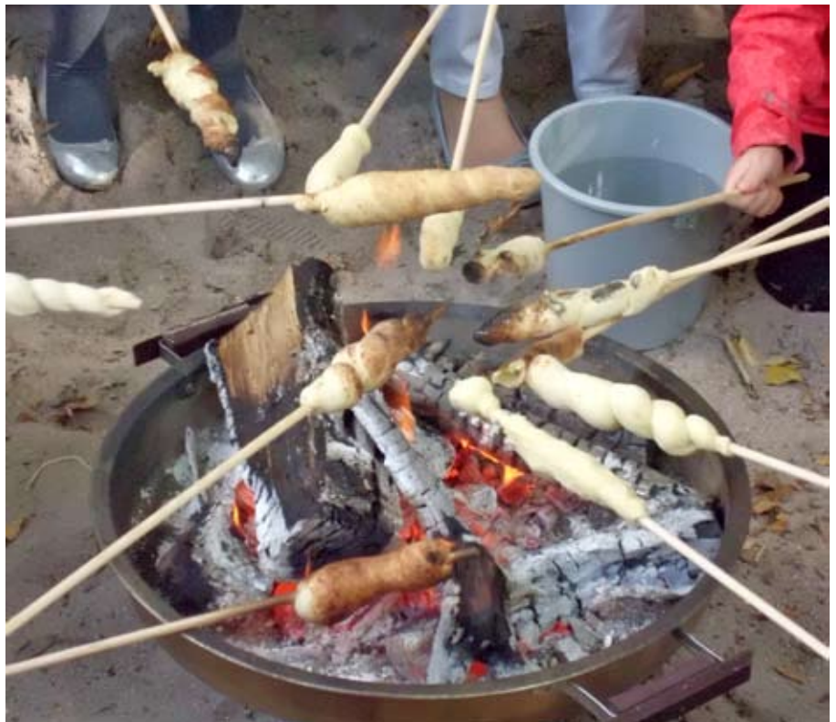
Stockbrot und Kartoffelsuppe: Zünftig ging's zu beim Mittelalterfest auf „Burg Krümelchen“. Stilechte Gewänder und ein mitreißendes Programm sorgten für ein unvergessliches Fest in der Kindertagesstätte Am Brunnengarten.