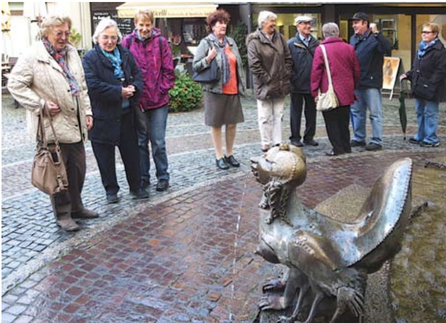
Beim Seniorenausflug: Elwedritsche gibt's wirklich – am Elwedritschebrunnen in Neustadt.