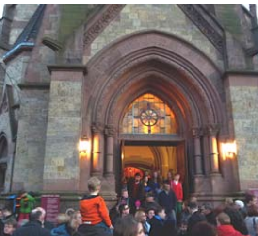
„Gott nahe zu sein ist mein Glück.“ (Jahreslosung 2014) Gottesdienstbesucher vor der Lutherkirche